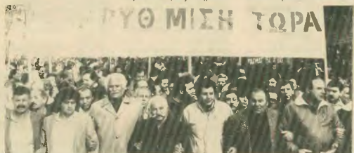
Και αυτό γιατί:

κής φορολογικής μεταρρύθμισης που ήταν δεσμευμένη της οικονομικής κυβερνήσεως και ανάγκη της κοινωνικής εξελίξεως της χώρας, όπως απαιτούσε το συνδικαλιστικό κίνημα με τις προτάσεις που έγιναν από τη διοίκηση της ΓΣΕΕ.