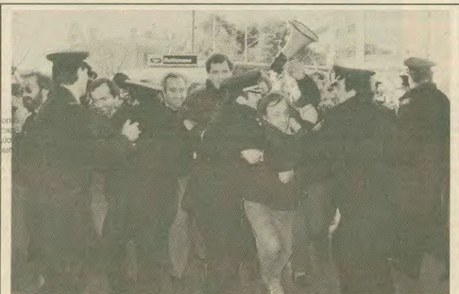
«Αιτίολογο» με την αστυνομία είχαν οι οδηγούς της ΕΑΣ, που ήλθσαν να υπερασπίσουν το δικαίωμά τους στην απεργία

Δ) Η κυβέρνηση εκδικείται τα συνδικάτα και με ένα νέο όλο τρόπο. Καταργεί την οικονο- μική τους ενίσχυση από την Εργατική Εστία. Και είναι χρο- νια των ιδίων των εργαζόμε- νων βεβαία, αφού ο κάθε ερ- γατοπαλλήλος δίνει το 0,25% του μισθού του στην