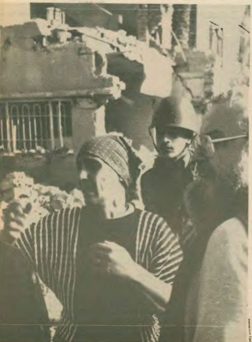
Μια κάτοικος της Βαγδάτης οδηγείται μπροστά στο κατεστραμμένο από τους βομβαρδισμούς σπίτι της