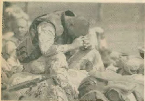
Σκωτικός ο Αμερικανός πιλότος λίγο πριν ξεκινήσει για μια από τις χιλιάδες επιδρομές στη Βαγδάτη