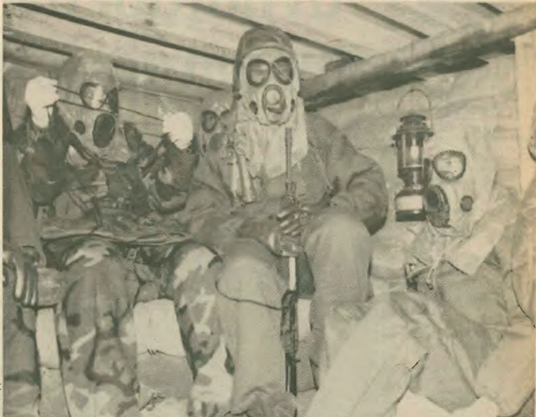
Το αμερικανικό όνειρο σε όλο του το μεγαλείο, όπως μας το στέλλουν στα σαλόνια μας τα μονοπόλια της εφημερίσης

Βγαίνει το συμπέρασμα ότι πίσω θυσία οι ΗΠΑ ήθελαν τον πόλεμο. Και τον ήθελαν για να επιβάλουν την κυ-