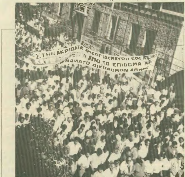
Οι αγώνες των οικοδόμων, αλλά και η ύπαρξη συγκεκριμένων προτάσεων εκ μέρους τους, είχαν σαν αποτέλεσμα η βελτίωση του νομοσχεδίου που αρχικά κατέθεσε η κυβέρνηση.

2. Με κοινή απόφαση των Υπουργών Εσωτερικών, Δημόσιας Τάξης, Εργασίας και Υγείας, Πόλεως και Κοινωνικών Ασφαλίσεων καθορίζονται οι ορα και η διαδικασία για τη χορήγηση, ανανέωση ή ανανέωση των αδειών εργασίας σε αλλοδαπούς, η επίσημη χρηματική εν-