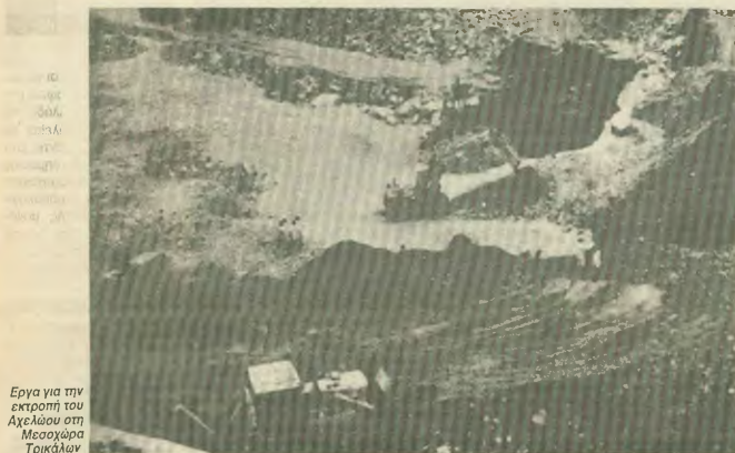
Εργα για την εκτροπή του Αχελώου στη Μεσοχώρα Τρικάλων

Καλούνται όλοι οι συνάδελφοι οικοδόμοι να συμμετάσχουν στο Συνέδριο με τις σκέψεις, προτάσεις και γνώμες τους για όλα τα προβλήματα που τους απασχολούν και πώς κρίνουν την πρόβλεψη και διεκδίκηση τους. Πως και με ποιες μεθόδους θα ενεργοποιήσουμε τους οικοδόμους να παίρουν δραστήριο μέρος στη ζωή και δράση των Συνδικάτων.