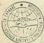
Καλούνται οι συνάδελφοι να συμβάλουν στον προβληματισμό

Στην Αθήνα στο Στάδιο Ειρήνης και Φίλων, πραγματοποιείται το Συνέδριο της Ομοσπονδίας μας. Το Συνέδριο γίνεται 3 μήνες πριν να λήξει η θητεία της Διοίκησης που είναι 3 χρόνια.