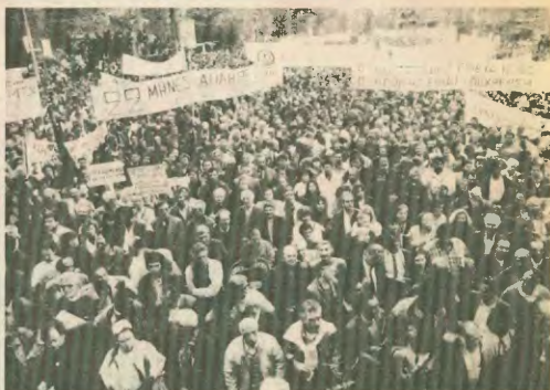
Από πρόραξη κινητοποίηση της ΓΣΕΕ

Το νομοσχέδιο αυτό λοιπόν έρχεται σε μια περίοδο που η ανεργία αυξάνεται και η ίδια η διοίκηση του ΟΑΕΔ μιλά για δραχμευμένα ανεργούς. Ο πρόεδρος του ΣΕΒ νίπτει τα χέρια του και αναφωνεί: «να θα υπήρχαν και άλλα λαούρα!». Ούτε ένα, ούτε δύο, αλλά κάποια Λαούρα! Είναι αναπόφευκτο, λέει, γιατί θα γίνουν ανακαταστάς στην ελληνική οικονομία. Και αμέσως μετά ελληνες