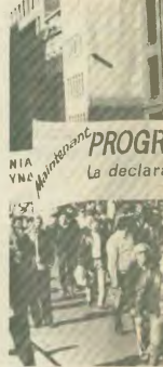
Από τη κινητοποίηση των σωματείων με 150 άτομα

Ποιό παροτρύνει το προοχόσθιο των αρχηγών των Κρατών - Μελών της ΕΟΚ και τις θέσεις της Γενικής Συννομοσπονδίας Εργατών Ελλάδας (ΓΣΕΕ).