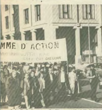
Εργαζόμενοι συνάδου στις Βρυξέλες στις 18-10-89 Η ΓΣΕΕ

γάρ: — κάθε πολίτης της Ευρωπαϊκής Κοινότητας έχει δικαίωμα σε μια κατάλληλη κοινωνική προστασία.