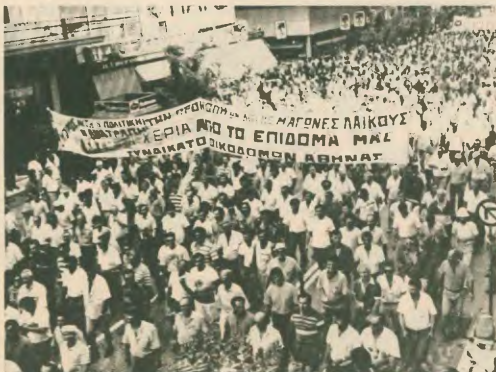
Υπολόγισαν χωρίς τον ζενοδόχο ότι μεμούντος του κλιμακωρίου δεν θα βρουν αντίσταση...

Να ζητήσω πάντα αποδείξη για την ασφάλισή που καταβάλλω, αν συνδράμω και έκτακτη ενίσχυση.