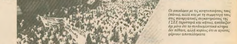
Οι οικοδομοί με τις κινητοποιήσεις τους (πάνω), αλλά και με τη συμμετοχή τους στις πανεργατικές συγκεντρώσεις της ΓΣΕΕ (αριστερά και κάτω), απέδειξαν ότι μόνο οι συνδικαλιστικοί κινήματα δεν πέφταν, αλλά κέρων ότι οι αγώνες γέρων αποτελέματα.