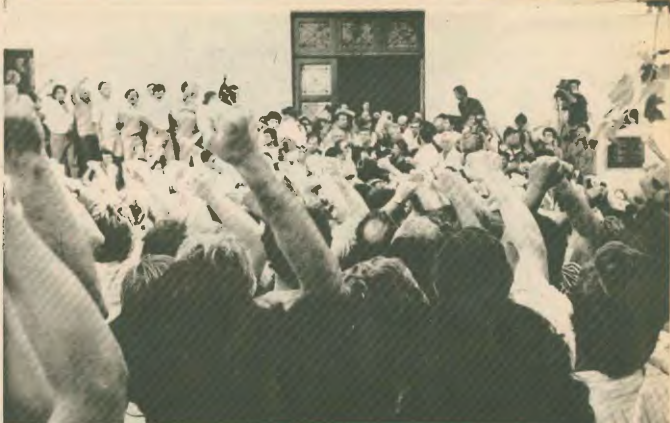
Οι συλληφθέντες εξέρχονται από την αίθουσα του δικαστηρίου

«Τυχερό» ο «νρυσούσιμος», Συσούσιμος τον αριθμίου 9. Ος γνωστό ο Σεπτέμβριος είναι ο έννατος μήνας του χρόνου. Τι κράτηση στη Γενική Ασφάλεια ήταν ζήμερόνατος 9/9 Το κελί της Γενικής Ασφάλειας ήταν τον αριθμό 9. Ο δε αριθμός των συλληφθέντων ήταν και αυτός 9. Οι μάρτυρες κατηγορίας επίσης 9. Ο πρόεδρος του δικαστηρίου ήταν 9 μάρτυρες. Οι δε αναγνώρι υπεράσπισης επίσης 9 (και για τους 9). Δεν γινάσκουμε αν έπαιξαν χαλαιο οι συνδικαλός και οι κέρδων. Είλομο κέρδος πάντως ήταν η απελευθέρωση τους, η αλληλεγγύη των εργαζομένων και των συνδικαλιστικών οργανώσεων, η μαχητικότητα και η μαχητικότητα των απεργών εκδηλώσεων.