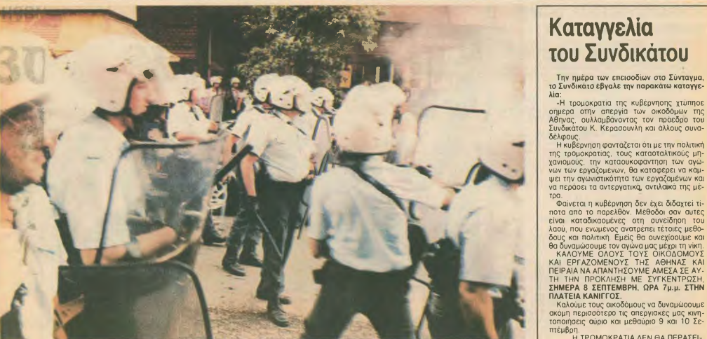
Αυτό το ρόλο επικύρωσε η κυβέρνηση στην Αστυνομία. Ένας είναι ο εθιμός, ο λαός...