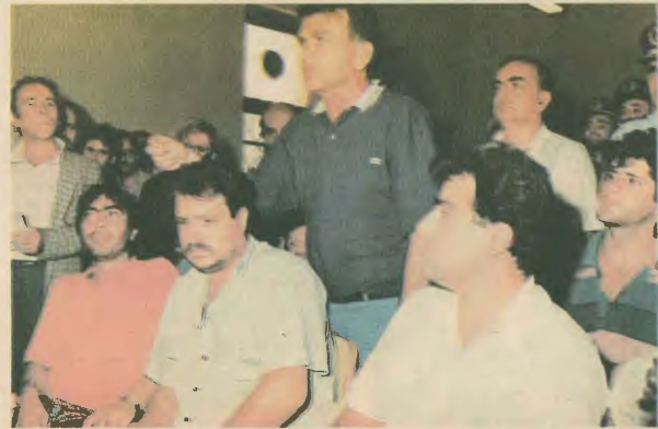
Χιλιάδες γρατίες υψώμενες έξω από τα δικαστήρια, ένα μέτρο αιγυλιφθέντες συνδικαλιστές ζητούν να γίνει η δική για να εγκαθίσταται τα πράγματα

Ας παρομοίω, όμως, τα πράγματα από την αρχή. Η τριήμερη απεργία, που είχε προκηρύξει η Ομοσπονδία για τις 8, 9, 10 Σεπτεμβρίου, είχε από την αρχή τεράστια επιτυχία. Χιλιάδες οικοδομοί έδωσαν το παρών στη συγκέντρωση, στην πλατεία Κόνιγγος, διαδηλώνοντας την πρόθεσή τους να υπερσπάσουν τα ασφαλιστικά τους δικαιώματα, το χειρισμό επίδομα, το βιοτικό τους επίπεδο, τις ίδιες τις κατακοιτίσες. Ακολούθησε η εντυπωσιακή σε όγκο και μαχητικότητα πορεία προς το υπουργείο Κοινωνικών Ασφαλίσεων. Η αντιπροσωπία των απεργών ζητούσε τον υφυπουργό Κ. Σιούφα, αρμόδιο για θέματα κοινωνικών ασφαλίσεων. Ο γενικός γραμματέας του υπουργείου, κ. Βαρθολομαΐος, διαβεβαίωνε ότι ο υφυπουργός βρίσκεται εκείνη την ώρα στο υπουργείο Εθνικής Οικονομίας και η πορεία στη συνέχεια καταβυθίζεται προς το Σύνταγμα. Οι οικοδόμοι ζήτησαν συνάντησή με τον υφυπουργό κ. Μάνο, ο οποίος εκείνη την ώρα βρισκόταν στο υπουργείο. Ο υφυπουργός ανήκει προκλητικά το αήθημα και αρνείται να δει την αντιπροσωπία, η οποία αποστρέφεται από 6 μόνο συνδικαλιστές, παρά το γεγονός ότι ο πρόεδρος της Ομοσπονδίας τονίζει ότι «εκπρόσωπο 200.000 άτομα». Την ίδια ώρα ισχυρές αστυνομικές δυνάμεις έχουν αποκλείσει την είσοδο του υπουργείου. Μπροστά ο αυτή την κατά-