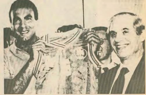
Τάρπλιτς και Αντρεσον το νέο αίμα για τον Άρη τις μέρες Γκόλη επιτυχίας. Ο σούπερ Νικ μετριοσμοσες επιτυχιου.

Ακόμα και στα 750 εκατομμύρια του Παύλου Γιαννακόπουλου