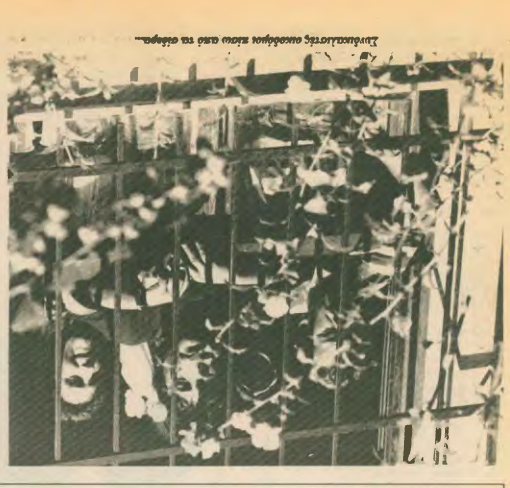
Συνελεύσεις ομοσπονδίας κλάσας κατά το εφάπαξ.