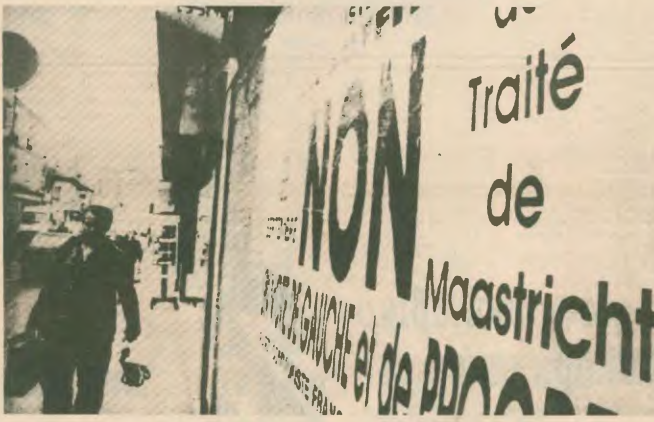
Αφίσις υπέρ του «ναϊ» στους δρόμους της γαλλικής πρωτεύουσας

Στη συνέχεια, ξεκίνησαν μια σειρά διαπραγματεύσεις κορυφών, οι οποίες είναι άγνωστο πού θα καταλήξουν. Το μόνο σίγουρο πάντως, είναι ότι η κρίση που ξέσπασε στο Ευρωπαϊκό Νομισματικό Σύστημα αποτελεί μια μόνο μορφή της γενικής οικονομικής κρίσης που διερχεται ο καπιταλισμός στον αγώνα για το ξαναοργάνωση του κόσμου και των αγορών.