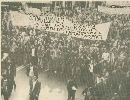
Οι οικοδόμοι στους άρητους του αγώνα, για να... έχει απορίες ο κ. Μητσοτάκης

Βελτιώσαμε την επόηση του ανέργων... και τα τέλη... ο κλάδος των οικοδόμων δεν έχει ανεργία και αφορά γιατί διαδύλων κάθε μέρα, ενώ είναι απόλυτα προνομήσιμα απ' αυτήν την πλευρά...». Αυτά δήλωσε ο προβουπουργός, τη στιγμή που η οικοδομική δραστηριότητα έπεσε στο χαμηλότερο επίπεδο της τελευταίας 30ετίας και χιλιάδες οικοδόμοι μένουν άνεργοι καθημερινά, τη στιγμή που οι εργοδότες, στην οικοδομή και τα τεχνικά εργα, χρησιμοποιούν χιλιάδες ανασφάλματα και με εξευτελιστικά μεροκάματα, απαασού σε βάρος της απασόλησης και χτυπούν τα μεροκάματα των αναδεδέλων, ο προβουπουργός το θεωρεί τυχή.