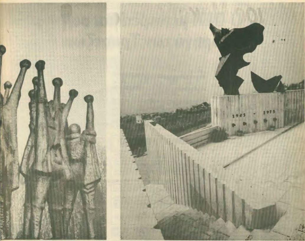
Το μνημείο της Απελευθέρωσης στη συρρικνή πόλη Πετς

της μιλάει στον την Τέχνη και το κοινωνία, για τη τη αξιών και πώς αντιμετωπίσουμε, κόπια, τη λιτότητα, δικάτων στη λύση ν προβλημάτων.