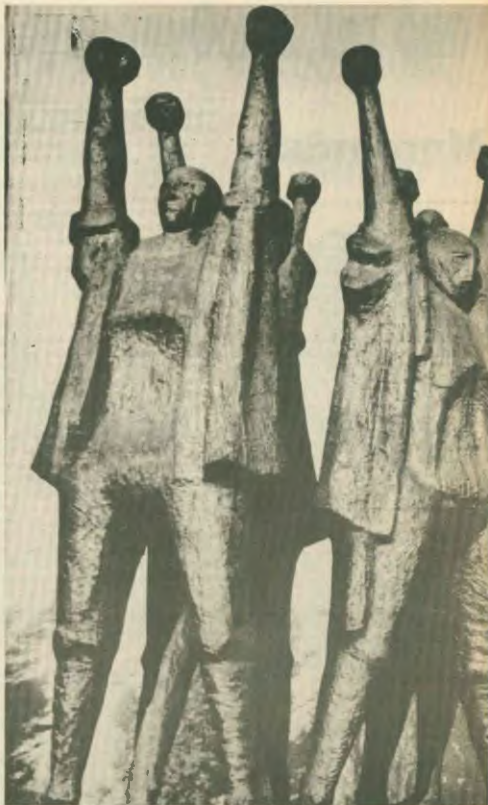
Το μνημείο στο στρατόπεδο συγκέντρωσης...

Μ. Μακρή: Αυτό είναι αλήθεια. Σω με ασπρήν κοινωνία, η εραφία είναι στα χέρια των