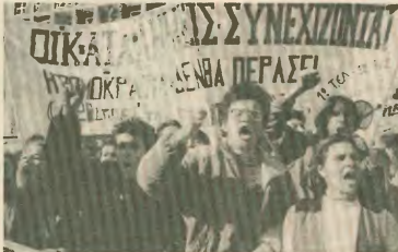
Μακριά νησιώτικοί είναι, όσα γράφουν πως με την τρομοκρατία θα κλέψουν το φρόνιμο των μαθητών

Ετσι και η εφαρμοζόμενη από την ελληνική κυβέρνηση πολιτική όχι μόνο υποστηρίζει τα προγράμματα της Παιδείας, αλλά προωθεί νέα όμινα της εκπαίδευσης, κρίσιμα. Οι νεοεπιληπτικές συνταγές ιδιωτικοποίησης της Παιδείας, παραρτήματα του διεθνούς και δημοσίου χαρακτήρα της, αναπαράγουν το σχολείο, έντασης του ανταρχισμού σε ολόκληρο το