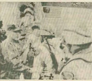
Πεζοναίτες από το 16ο καραβινοσύνταγμα στο Κουβέιτ, για να επιβάλουν τη θέληση των αμερικανών της Ουάσινγκτον

Οι βάρβαρες επιδρομές του Ιράκ και η προστομαζόμενη επέμβαση στη Βοσνία αποδεικνύουν ότι οι διεθνείς σχέσεις μπαίνουν στην πιο επικίνδυνη φάση στρατιωτικοποίησης. Απειλείται η ειρήνη σε όλο τον πλανήτη από τις πολεμικές προθέσεις και πράξεις των «πλανηταρχών».