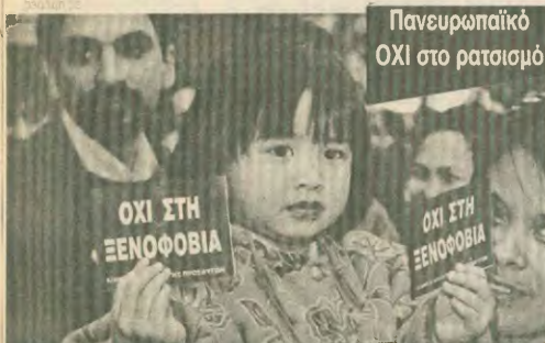
Πανευρωπαϊκό ΟΧΙ στο ρατσισμό