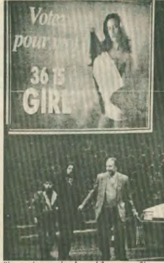
Όχι οι ημίγυμνες φρίδες δεν καθόρισαν να ανεβούν το πάθος της προεκλογικής εκστρατείας

Οι γαλλικές εκλογές δημοψήφισαν αναμφίβολα μια νέα κατάσταση στη χώρα, από την οποία κρίθηκε να βγάλει κανείς ορισμένα συμπεράσματα. Βασικό χαρακτηριστικό τους ήταν οπωσδήποτε η σαρωτική ήττα των σοσιαλιστών, οι οποίοι έχασαν γύρω στα 200 έδρες στη γαλλική εθνοσυνέλευση. Συνακόλουθα τα δύο βασικά κόμματα της Δεξιάς διέσπασαν μια ισχυρή πλειοψηφία (84%) σε έδρες που σε περίπτωση όμως δεν ανταποκρινόταν σε ψήφους και οφέλητα αποκλειστικά στο εκλογικό σύστημα. Η μεγάλη αποστολή μεταξύ λαϊκής βάσης και κοινοβουλευτικής δύναμης είναι ανόμοια στα παρέρη σημαντικό ρόλο στη παρέρη εξέλιξη. Ο δεύτερος γαλλικός επιρροαίος λοιπόν τη σύσταση της νέας σοσιαλιστής, στους οποίους όμως αντίθετα η πρόεδρος Μίτεραν. Η προεδρική θητεία άρχισε ως γέννηση το 1995. Εμπνευσμένη είναι και γίνεται αναπροσαρμογή η περιήγηση «οικονομική», ως εκκλιση τη χρόνια, γεγονός που δεν φαίνεται να δυσκολεύει και ποτέ τα πράγματα. Αλλιώτικα κορυφαία παράγοντες των δύο παρατάξεων είχαν φροντίσει ακόμα και πριν τις εκλογές να διασφαλιστούν ότι δεν θα αλλάζον και πολλά