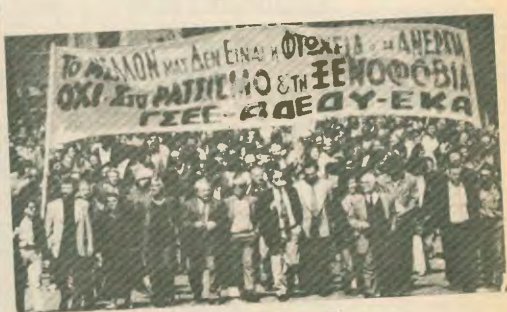
Τι θα μπορούσε άραγε, να φοβηθεί ακόμη και ο πιο διαστραμμένος τους απ' αυτό το άτακτο και αγριολέη προσηπιάκι; Δεξιά, πορεία στα γραφεία της ΕΟΚ στην Αθήνα, την Παρασκευή, 2 Απριλίου