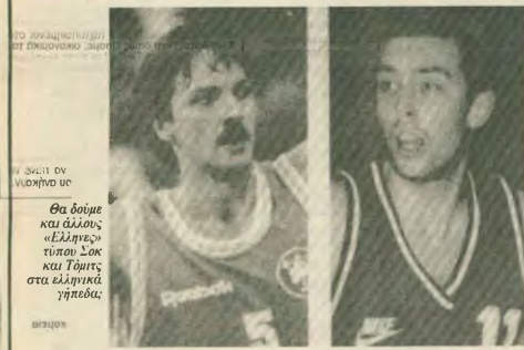
Θα δοεί και άλλους «Ελληνες» τύπου Σοκ και Τζατζι στα ελληνικά γήπεδα:

Όσον αφορά στα φάρμακα, που ήδη χρησιμοποιούνται, τόνισε ότι αυτό κυρίως αναστέλλουν τη νύση και μάλιστα, πρόσφατα Γ' αυτό πολλά αναμνήματα από τα νέα φάρμακα, που θ' αναδειχθούν η συνεχής παγκόσμια έρευνα.