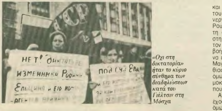
«Όχι στη δικτατορία» ήταν το κίνημα σύνθημα των διαδηλωσών κατά του Γέλτσιν στη Μόσχα

Οι εξελίξεις στη Ρωσία παίρνουν τη μορφή χιονοστιβάδας και η χώρα απεικονίζεται κυριολεκτικά — ετούτα και οι συμβιβασμοί βίαιων προσώπων αυτή την προσπάθεια, προς ένα ανεξέλεγκτο και καταστροφικό κατήφορο. Όταν όλες οι κόμμοσ μιλάει για την πιθανότητα εμφύλιου πολέμου, αυτό δεν μπορεί παρά να υποδηλώνει σοβαρά την αναστάτωση, καθώς η ύπρηξη ενός σημαντικού πυρηνικού αποπλοιστού στη χώρα συνεπάγεται τεραστίως κίνδυνους για την παγκόσμια ειρήνη και ασφαλεία. Σκεπτός όμως του κερμένου αυτού δεν είναι να σχοληθεί με την κατάσταση στη Ρωσία, καθώς οι εξελίξεις τρέχουν συνεχώς και άρα κινδυνεύουμε να βρεθούμε εκτός πραγματικότητας. Σκεπτός είναι, με αφορμή τις εξελίξεις αυτές, να ξαναθεσπίσει το απορριπτικό πρόσωπο του διεθνούς κοινοβουλίου, του υπερμερλή και του υπερδύναμτος, οι οποίοι φανερά έχουν κάνει την υποκρισία παλιά πολιτική και πρακτική τους, καθώς στο