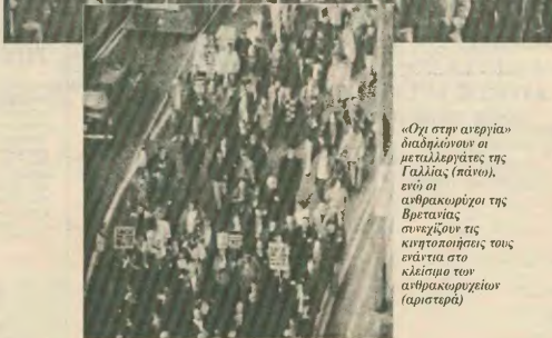
«Όχι στην ανεργία» διαδήλωση οι μεταλλουργοί της Γαλλίας (πάνω), ενώ οι ανθρακορύζοι της Βρετανίας συνεχίζουν τις κινητοποιήσεις τους ανάγεια στο κλίμα των ανθρακορύζοιων (αριστερά)

Η επιλογή της Παρασκευής, 2 Απριλίου, ανά μερα πανευρωπαϊκής δράσης του συνδικαλιστικού κινήματος στις χώρες της ΕΟΚ, αν και είχε από την ίδια την εξήγηση της μια σειρά μεγάλες αδυναμίες, βοήθησε εντούτοις — μέσα στα στενά περιθώρια που είχε — στην κατανόηση και στην ανάδειξη των τεράστιων προβλημάτων, που αντιμετωπίζουν σήμερα οι Ευρωπαίοι εργάζόμενοι.