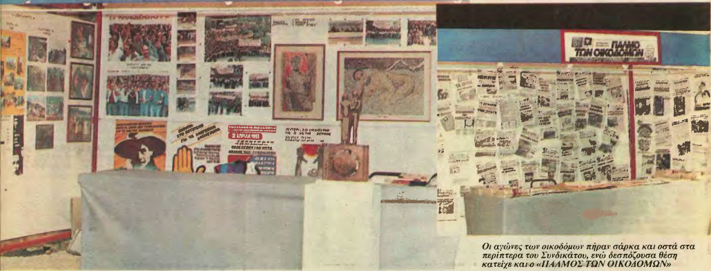
Οι αγώνες των οικοδόμων πήραν σάρκα και οστά στα περίπτερα του Συνδικάτου, ενώ δεσπόζουσα θέση κατείχε και ο «ΠΑΝΟΣ ΤΩΝ ΟΙΚΟΔΟΜΩΝ»

ΟΙ ΛΙΘΕΣ ΓΙΑ ... ΕΡΓΩΝ ΑΚΑΝΑΘΗΤΗ ΕΝΑΝΤΙΑ ... ΡΑΤΣΙΣΜΟ ... ΞΕΝΟΦΟΒΙΑ