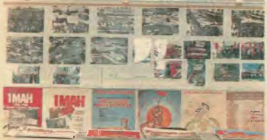
Επιτυχία σημείωσε το διήμερο στο Πεδίο του Άρεως