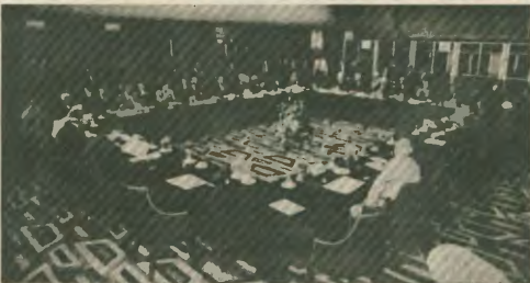
Μια φιλερηνική πρωτοβουλία δεν είναι αρκετή, για να μπει τέρμα στο δράμα του γιουγκοσλαβικού λαού

Αποδείχτηκε περίτρανο ότι η Ελλάδα μπορεί να γίνει παράγοντας ειρήνης και σταθεροποίησης στα Βαλκάνια