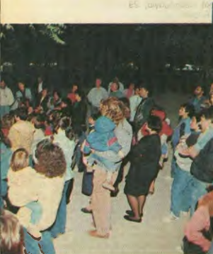
ή τους στις εκδηλώσεις. Αριστερά, συζήτηση για την κατάσταση του δημέρου