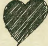
Ενας στους πέντε Έλληνες με πρόβλημα υπέρτασης. Αυξάνεται ο κίνδυνος εμφράγματος στις γυναίκες. Νέα μέθοδος για τις αρρυθμίες