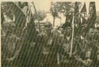
Οι χαλυβουργοί της ανατολικής Γερμανίας δόουν καθημερινά τη δική τους μαχη

Σοβαρά επεισόδια στο Βερολίνο την Πρωτομαγιά - Οδομαχίες και δεκάδες τραυματίσμοι