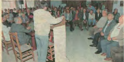
Οι οικοδόμοι τιμούν τους παλαιμαχούς συναγωνιστές

Ανάγκη νέων φιλειρηνικών πρωτοβουλιών για το Γιουγκοσλαβικό (σελ. 12)