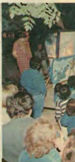
Τα παιδιά είναι η τιμή μας

Για την αλληλεγγύη: Τις υπαγόδων τον οικοδομών στην Νικαράγουα και την Κούβα.