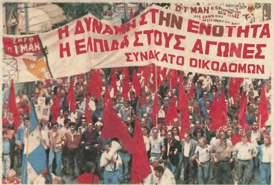
Σελ. 6-9 Επιβλητική η παρουσία των οικοδόμων στην Πρωτομαγιάτικη συγκέντρωση και πορεία