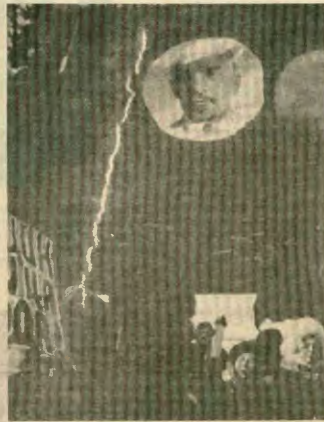
Στη μνημόνα από διαδήλωση κομμουνιστών στη Ρωσία

η ευθύνη αποδόθηκε στους διαδηλωτές, αλλά όπως αποδεικνύουν οι βιντεοταιρίες, οι διαδηλωτές είχαν ήδη υποχωρήσει και τα οχήματα βρίσκονταν στα χέρια της Αστυνομίας.