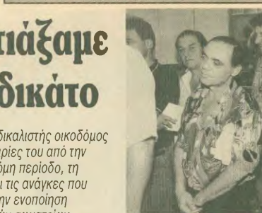
Στην ούρα για να ψηφίσουν στις εκλογές του Συνδικάτου

Στην ενότητα η δύναμη Στον αγώνα η νίκη Όπλο μας η απληλεγγύη