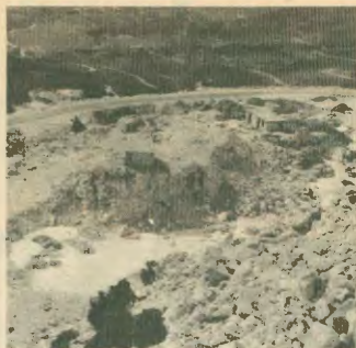
Οι πληγές των ορεινών όγκων της Αττικής δεν θα κλείσουν από κανένα ιδιωτικό ίδρυμα...

Είναι συνυπευθύνου όλοι αυτοί οι κρατικοί, που από τη μια θεωρούνται από την κρατική μηχανή και από την άλλη βράζουν το κράτος για την ανακωχή του να διαχειριστεί σωστά τις δημοσίες υποθέσεις. Φτάνουν να παραχωρούν ακόμη και τα δόση, την ανάσα της πόλης, την ανάσα μας, στον