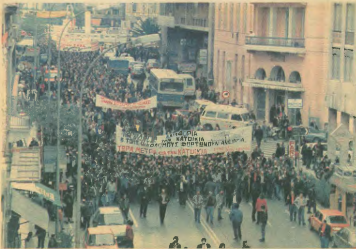
Ημέριτη επανταχία σημείωσε η απεργιακή μας κινητοποίηση στις 20 Γενάρη. Στη φωτογραφία η πορεία στο υπουργείο Εργασίας

Συγκέντρωση στις 10.00 το πρωί στην πλατεία Κάνιγγος