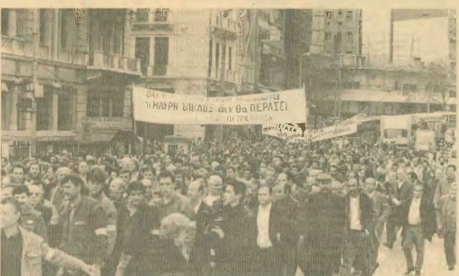
Από την απεργιακή κινητοποίηση στις 20 Γενάρη

Το σκληρό είναι ατιμήνω καταρνήσιος εξής: «Ο ΟΕΚ θα ερασιματέσει» ο ΟΕΚ στο δικαστήριο αδύνατα τον εαυτό του από τη δικαιοσύνη του Μπόλιατ, έτσι που να χόσει την υπέρθεση ο ΟΕΚ και το επίπεδο θύλα είναι ένας. Προκειμένου — θα πουν — να δώσουμε 2 δισ. αποζημίωση, καλύτερα να αγοράσουμε τα διαμερίσματα...!!!».