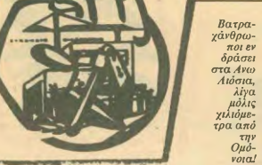
Βατραχινόγειο εν δράσει στα Άνω Λιόσια, λίγα μέτρας χιλιόμετρα από την Ομότιμη

Το σερπινό πρόσωπο των παραρτημάτων για τη συνκοίτις, την ειρήνη, την εργατική τάξη της χώρας μας