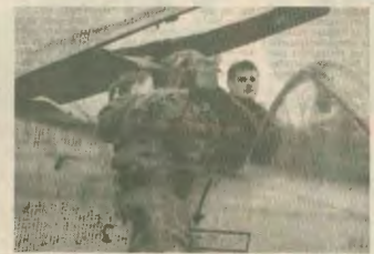
Τα βομβαρδιστικά και η ένταση δεν προσφέρουν διεξόδους στα προβλήματα της Βαλκανικής

τους δίνουν κώλυμα. Επόμεινο είναι αυτό τα εθικιμοποι και η άλλη πλευρά σε πρόχρημα για τις όποιες κατηγορίες κατά της Ελλάδας. Οι κινδύνοι, που συνειπνάζονται για τη χώρα αυτή η λογική, είναι αμετροεπεί. Καθώς μόλις όλο οι γενινοί μας χωρες έχουν «παροδοσασες» διεκδικήσεις σε βάρος της Ελλάδας, τα πράγματα γίνονται χειρότερα. Και προφανώς δεν είναι λίση το να χηρπομοποιούμε ομιαμίες με κάποιες βαλκανικές χώρες ενάντια σε κάποιες άλλες, πράγμα που μόνο ομηση των κινδύνων γενινοκότερη αναλέσκει μπορεί να προσφέρει. Ούτε βέβαια είναι λύση η αναστήρηση προτοσας στις δύο των μεγάλων δυνάμεων, οι οποίες εμπρηκα έχουν αποδείξει ότι μόνο για τα δικα τους συμφερότα ενδοσφαιρτά.