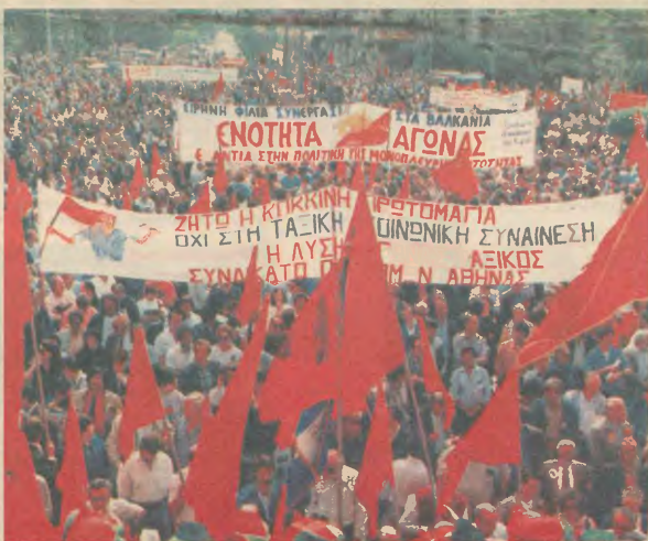
Αφιέρωμα στην Προτομαγιά — Το χρονικό των θυσιών στη σελ. 3