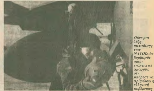
Δεν είναι η καταδίκες των ΝΑΤΟικών βομβαρδισμών ενάντια σε αμείχρους δεν μπόρεσε να αρρήσει η ελληνική κυβέρνηση δεν κρίνει για τον εαυτοί της ούτε και το δικαίωμα ενωμώρηξ με πρόβλεξ που βάρουν με άμια τις περιοχές ακριβώς δίπλα από τα ομόρα της χώρας. Η κηηηθηση, αντίθετα, έχει ένα και μοναδικό στόχο. Να διαμειδωθεί, να αποκλείσει ακόμα και την κηηηθηση, να απειλήσει με ψελλαιοί έστω και την πλέον ανώμηνη διάσφα στα έργα των εκηλημιαστών ΝΑΤΟ «Οχι», αναθάρσους ο κυβερνητικός εκπρόσωπος. Δεν ηρηκται η κυβέρνηση του ΠΑΣΟΚ να επανεξέθει τη στάση της στο θέμα του πολεμικού «τελεσφόργου διαρκείας» κατά τη Βοσνίας. Το τελεσφόργου που «νομιομοποιί» την πολιτική των βομβαρδισμών. Δεν σιθώνεται την ανήγη να απολογηθεί για την υπογραφή της κατά από ένα τελεσφόργ που μετρήσετε τον πόλεμο σε καθεστώς, για τους λαούς της Βαλκανικής. Η στάση αυτή της κυβέρνησης την καθιστά συνώνη στις όποιες εκηλημιατικές ενέργειες των Αμερικανών. Τελικά και χωρίς άλλες παρεμβάσεις, η εξεθρμωλη υποσηή της κυβέρνησης, σε εζέμιο των δυνάμεων εκείνων που δολοφονούν λαούς και στο όνομα των άνομων συμφερότων τους, την καθιστά επικίνδυνη για τους εργαζόμενους, για τον ελληνηκό λαό.

τους στη μοσράδα. Όλα τα άλλα περι ανθρωπότητα, περι ειρηνητευτική παρεμβάση, περι ελπίδα σφαιρικών αποτελού μόνο προπέτασμα κηηνού. Οι δολοφονικές επιθέσεις όμως των Αμερικανών ηρθαν να αποστηρουν την ελληνηκή κυβέρνηση από κάθε ένωση ανείμησης. Ούτε μια λέξη κατοήθηξ των «Ρόμπιν» δεν μπόρεσε να ψηλώσει η κυβέρνηση, ούτε μια κομμένη ανιαιήξ στην επέκταση του πλεύμα στα ομώρα μας. Αντίθετα, ο Έλληνας κυβερνητικός εκπρόσωπος, που πάντα μιλά «ε' ονοματός του πρωθυπουργού, οι άλλοι και ομολογία η κηηηθη, επέδειξε το πόσο του εκπεκροσίου» των «ηερικών» του Πενταγώνου στα Βαλκάνια. Υπεραμύθησαν, μάλιστα, του «δικαιοσύμην» των ημιαρμιαστών να σπένουν το θάνατο, χωρίς να ζητούν το λόγο από κανέναν. Χωρίς καν να ενωμώρησαν. Γιατί; Επειδή, κατά την ελληνηκή κυβέρνηση «δεν προβλέπεται παρομία διαδικασία διαβουλεύσεως των πολιτικών οργάνων του ΝΑΤΟ, πριν από τη ληψη αποφασητικών αποφασώνων... Η με άλλα λόγια, η κυβέρνηση του ΠΑΣΟΚ, η προεδροβλήση κατά το τρέχον εζέμιο στην ΕΕ, δε