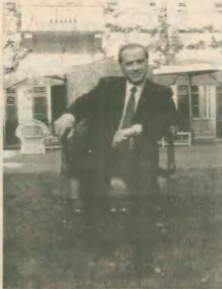
Ο Μπερλουσκόνι σε μια από τις βίτες του, έτοιμος να καθίσει και στην προεδρικοσυρική καρέκλα.

Χωρίς πραγματική Αριστερά ήταν επίσημο λοιπόν να κυριαρχήσουν δυνάμεις του κεφαλαίου, οι οποίες μάλιστα φορούσαν το προσώπιο της ανανεώσης. Όμως η νίκη αυτή του Μπερλουσκόνι προκαλεί ορισμένους ερωτηματικά και προσφέρει στοιχεία συγκρίσεως με άλλες ευρωπαϊκές χώρες, αλλά και με την Ελλάδα. Και πριν από όλα γιατί ένα πολιτικό κόμμα με μόλις τρεις μήνες παρουσία στα πράγματα της χώρας καταρρέει να καταλάβει την πρώτη θέση; Και γιατί ένας μεγατώνος του πλούτου κατέβηκε στο προσεκλικό μπλοκ, αντι να ακολουθήσει τη συντηρητική να στείλει στο Κοινοβούλιο και στην κυ-