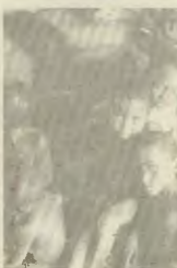
Τα παιδιά πάντα τα αθώα θύματα

Οι Βέλγοι που κληρονόμησαν στη χώρα μετά τον πρώτο Παγκό-