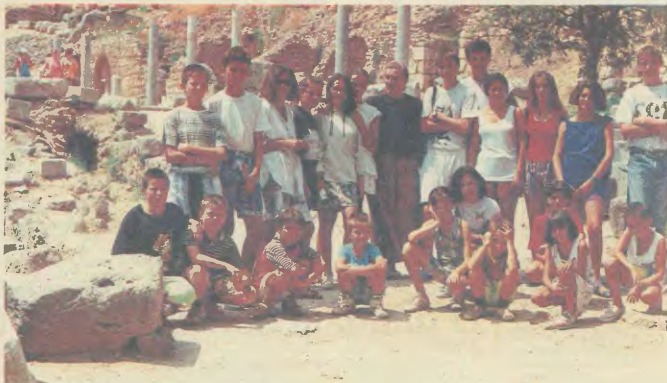
Στην επίσκεψη από την επίσκεψη στους Δελφούς

Εμείς τα αποχαιρέτισαμε με μια ευχή. Να σταματήσει γρήγορα ο πόλεμος στη χώρα τους για να μπορούμε όλα τα παιδιά να ζήσουν σε μια κοινωνία ειρηνική, χωρίς πόλεμους και ακοτακμούς.