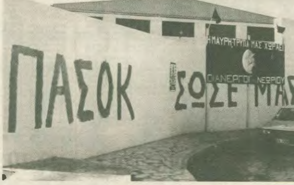
Από το «ΠΑΣΟΚ ούτε μας» στο «ΠΑΣΟΚ μας πούλασε». Οι ανταπότες και ο κυβερνητικός συνδικαλιστής αποτελούν μόνο την αρχή των καταρροών...

Τελευταία επεισόδια στο φιλιά του ξεπουλήματος, τα νομοσχέδια για τον ΟΤΕ και την Ολυμπιακή,