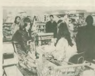
Προσχή στα γύφια για να εσπερήθει από τις εκπίσεις της Εφορίας

3. Αγορά βιβλίων, σχολικών ειδών και ειδών γραφικής ύλης, χαρτίων κάθε είδους (χαρτί υγείας, χαρτοπετσέτες κλπ.) απορριπτήρια, φιλμ, κασέτες ήχο και βίντεο, δίσκοι, παιχνίδια, άπλων, καθώς και άπλων για αθλητικά και σωμακωκτικά υλικά (βραβάρια, ανόπνευμα κλπ.). Εξοκλόυθου, δε, να εκπέμπουν τα