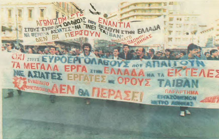
ΑΛΙΜΟΝΟ ΜΑΣ ΑΝ ΠΕΡΑΣΕΙ Η ΚΥΒΕΡΝΗΣΗ ΤΗΝ ΑΠΟΦΑΣΗ ΤΩΝ 12 ΚΑΙ ΤΩΝ ΕΥΡΩΕΡΓΟΛΑΒΩΝ

ΕΞΙΣΧΩΘΕΙΤΕ πριν να είναι αργά το δικαίωμα στη δου- κια για τη διατήρηση των δικαιωμάτων ΑΓΩΝΑΣ στον αγώνα υπάρχει θα δικαιωθούν οι α- με ενότητα και πάλι με πείσμα και αντοχή. ΕΚΙΖΟΥΜΕ