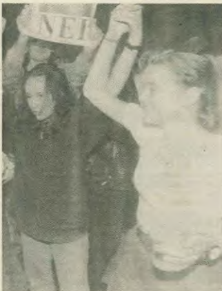
Θύελλα ενθουσιασμοσ προκάλεσε η ανακοίνωση του αποτελέσματος

παρουσιάζουν τη Νορβηγία στο «μιαρο πρόβλο», αλλά οι ίδιοι οι Νορβηγοί είναι υπερίφρονοι που ψήφισαν «Οχι». Δεν είναι γρήγορο ενδιαφερόν το ότι και οι υπολάσιοι σκανδιναβικοί λαοί θέλησαν τους Νορβηγούς με δέος, μακ και τολμήσαν να πουν ΟΧΙ στην «ακατομήνητη» Ευρωπαϊκή Ένωση.