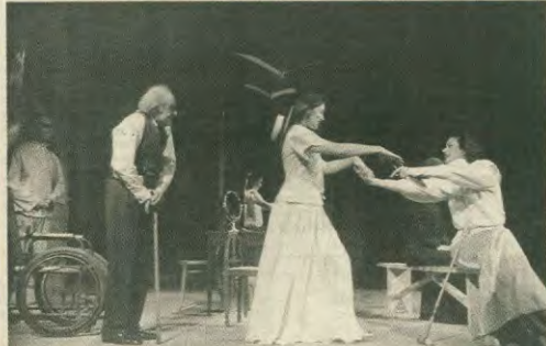
«Ο Γλάρος» του Τσέχοφ στο θέατρο «Αιωνία»