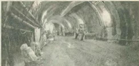
Το Μετρό παραμένει από τα λίγα έργα που προχωρούν, έστω και μετ' εμπόδων.

βάσει της συμφωνίας για αναλογική ανακωστρο στα υποκαταστήματα έργα. Δωστε χρομή εσείς, για να δώσουμε κι εμείς, λένε οι Κοννοί. Η δασκή όμως από ένα αυτό που αποκαλέσει διατήρηση των ισορροπιών. Τα λεγά είναι πολλά και τα αναμενόμενα κερδή για τις εταιρείες τεράστια. Εάν εξήγηται και το ενδασφύρον ορισμένων κύκλων να ξεκινήσουν επιτέλους το έργο, αλλά εξήγηται επίσης και οι πόλεμος συμφερότων, που λειτουργεί αντίτροφα και αποδίδει στην ομαλή διεξαγωγή των δασκωσιών.