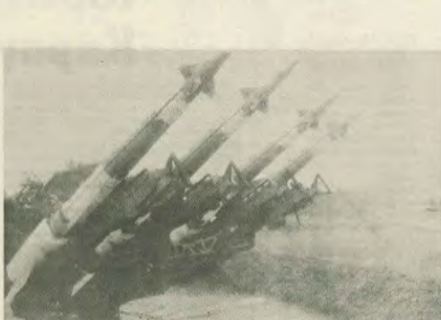
Στρατιωτικές προμήθειες έτοιμες για εκκένωση

Προσέχρησαν μάλιστα και παραπέρα οι ΗΠΑ, ανακινώντας τις προθέσεις τους για μονομερή απόσυρση των δυνάμεών τους από την περιοχή. Δυνάμεις, οι οποίες επέδωσαν την ήττησή του εμπόργκο όλων στις εμπόλεμες πλευρές. Πρόκειται για μια κίνηση, η οποία γερνει την πλαστική εμφανία υπό τον Μουσοβιάνο, σε μια στιγμή