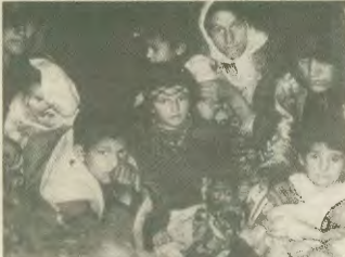
Οι Κοϊνδοί κρίβονται σε σπηλιές για να γλιτώσουν από τον ταυρκικό στρατό

Μία οργάνωση από τη Βοστώνη, που ονομάζεται «Γιατροί για τα Ανθρώπινα Δικαιώματα», οργάνωσε ένα δεύτερο τελετήριο σεμινάριο στην Κωνσταντινούπολη τον περασμένο μήνα, το οποίο παρακολούθησαν περίπου 100 γιατροί από όλη την Τουρκία. Στόχος του σεμιναρίου - παρό-