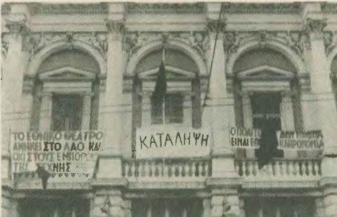
Πράξη εθνικής μεσοδοσίας και εγκλήματος εναντίον της εθνικής κληρονομιάς, όπως το Εθνικό Θέατρο, στα σάγονια της ιδιωτικής πρωτοβουλίας.

μουσικός. Πώς, λοιπόν, να χαρακτηρίσει κανείς το σπληνικό υποκαλλιέργη, που από το βήμα της Βουλής αποκρίθηκε την ερωτηστική δημόσιαρχη χαρακτηριστικώς την «αυριχή επιπέδου». Τι να πει κανείς για έναν άνθρωπο που σπληνικά εντελώς μπροστά στην υποκαλλιέργη των ιδιωτικών τηλεοπτικών καναλιών,