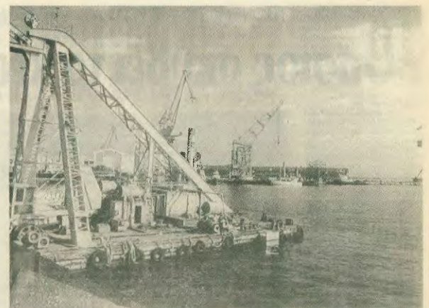
Το Νεώριο πουλήθηκε με 250 εκατ. δρχ. προκαταβολή και 2,15 δισ. δρχ. σε 6 άτοκες ετήσιες δόσεις, όταν η αξία του ανέρχεται σε 16 δισ. δρχ.

Ποιος θα πάρει το 5,8 δισ.; Μα ο Περσικός, που φόρτασε τα ναυπηγεία έναντι 12 δισ. όταν η αξία τους (σε τιμές 1992) ήταν 25 δισ., που τα πήρε αφού πρώτα χαρίστηκαν τα χρήματά τους 35 δισ. περίπου, που αντί να αυξήσει τις θέσεις εργασίας, τις μείωσε σε από 2.200 σε 1.670 και τις μείωσε