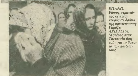
ΕΙΛΑΝΟ: Ρώσοι στρατιώτες κείτεται νεκρός σε όρμη της προτεινισσας Γκρόζνι. ΑΡΙΣΤΕΡΑ: Πληθυσ στην Τσετσενία θρηνούν για το θάνατο των παιδιών τους

σοβιετικής εξουσίας. Τότε, ακόμα και οι δήλωσεις για «κυριαρχία» της Τσετσενίας δεν αποτελούσαν πρόβλημα για το ρωσικό