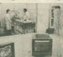
Η πρόληψη αποτελεί βασικό παράγοντα εξάρτησης των κινδύνων εμφάνισης του καρκίνου

Η ουσιαστική διαφορά του σύγχρονου ανθρώπου μπορεί να αποδοθεί σταθίρα έναντι των κλητικών προδοσιών από πολλές μορφές καρκίνου. Αυτό το μίνιμου στέλνουν οι επιστήμονες, οι οποίοι της τελευταίας δεκαετίας μελετούν συστηματικά τη σχέση καρκίνου και διατροφής και είναι πλέον σε θέση να ανακωσώσουν το πρώτο υπερμπαρταίο των εσέρων τους. Βεβαίως, μελέτες, αποδοδείξουν ότι το μίνιμου για τη ζωή μας, αλλά και για τις υπόλοιπες χώρες της περιοχής, καθώς ο μεσοδοσιακός τρόπος διατροφής κινείται από τους πλέον ιδιωνικούς για την πρόληψη του καρκίνου. Βασικότερο είναι ότι, αυτό το γεγονός είναι η πλώσσα σε φρούτα και λαχανικά διατροφής των μεσοδοσιακών λαών.