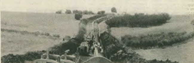
Ακόμα και το έργο του φυσικού αερίου βρίσκεται στη δίνη των μεγαλοσυνφερόντων

Αίλιμασά τους λοιπόν, αλιμώμενος στους νέους, αλιμώμενος στους νέους, αλιμώμενος σε όλους, αν αφήσουμε να είναι ποινήσαν τέτοιο είδους μέτρα. Αν αφήσουμε τους εντολοδόχους του Μασοιχτή να τινάζουν στον αέρα και τα τελεσίτατα ίχνη κοινωνικής ασφάλισις. Η έκτακτη οργάνισή της άμυνας μας και μαζική συμμετοχή στους αγώνες που θα ακολουθήσουν, είναι τελικά οι παράγοντες που θα κρίνουν την έκβαση της μάχης.