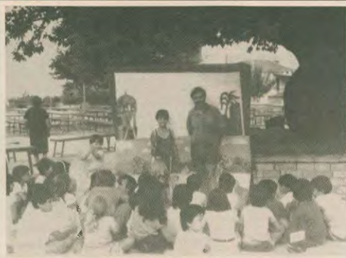
Καλοκαίρι στην ύπαιθρο. Τα παιδιά ενός χωριού έξω από τα Γιάννενα, κάτω από τον πλάτανο, ακούνε και μπαίνουν για τον Καργαγιόζη, πριμμένοντας να συντροπιάσει για να αρχίσει η παράσταση

Και να ξέρετε ότι: Δεν μας κάνει κανείς τη χάρη. Δεν είμαστε και δεν αισθανόμαστε υποχρεωμένοι σε κανέναν και τη τελευταία δεκάρα των εδρών της κατασκηνώσεως πληρώνεται από δικές μας κρατήσεις.