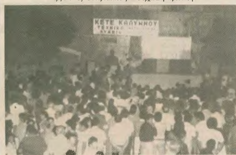
Κάτοικοι της Καλύμνου παρακολουθούν παράσταση Καργαγιόζη από τον Γ. Μαριάμ