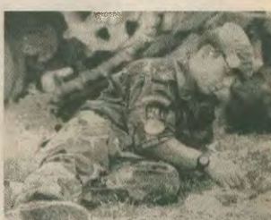
Εργασιές του ΝΑΤΟ κάνει σχέδια στο έδαφος, για το πώς θα προηγηθούν οι πολεμικές επιχειρήσεις

Η αναχώρηση της κρίσης και του πολέμου τη Βοσνία, ιδιαίτερα τη στιγμή που υποτίθεται ότι γίνεται προσπάθεια έρευνας ειρηνικής λύσης, ενάντια της ανισοκράτεια, ενώπιον της αθεσπίατος σε σχέση με το μέλλον της Ευρώπης και ειδικότερα των Βαλκανίων. Ο αστέρισμος της Νέας Τάξης. Πραγματικά προβαίνει πιο πολυεργατικά και απειλητικά, τώρα, αλλά ταυτόχρονα ευρωπαικίζετα και αμνηστικός, γιατί παρά τη συντηρητική στρατηγική υπεροχή του οδηγείται να κωμην την αντίθεση εναντίον μακρού, σχετικά, λού.