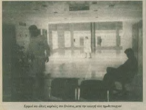
Ελληνική και άλλες κορδέλες στο Λόδιον, μετά την εκλογή νέου πρωθυπουργού

λάτο Αφρατέσις». Πρόκειται, σε αποκαθιστάση, για το «οραμα» Σημίτη να εξαρτάται ένα ελάχιστο από δικαιοσύνη για το όλο και περισσότερο αυξανόμενο στρώμα που οδηγούνται στο περιβάλλον, ώστε να μην «απειλεί» η κοινωνική ανισχύη. Δηλαδή, να αποφευχθούν διασπορές στην άρχουσα τάξη κοινωνικές εκρήξεις. Τι επαγγέλλεται η παραπάνω αλληλεγγύη; Ότι: «οί είναι πανικόβλητη αντίδραση της Πολιτείας να προσπαθεί να περνώσει όλες τις θέσεις εργασίας». Δηλαδή, «την «αυτονομία» της ανεργίας... θ) «το δίλημμα μεταξύ σταθεροποίησης και αύξησης των χαμηλών συντάξεων είναι ψευδοδίλημμα, επειδή