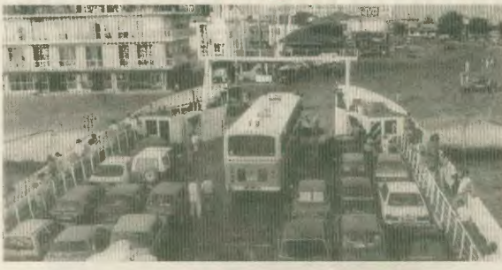
Διόδια - φασία - τον θα προεργάζουν το πετοχιώλιο, επιβάλλει η εκμετάλληση από τους ιδιώτες της νέας γέννητας στο Ρίο - Αντιρριο

Μ ετά το Σπίτο το «μεγάλο φαγοπότι» με τα μεγάλα έργα συνεχίζεται με τη ζεύξη Ρίου - Αντιρρίου και την Ελευθέρω Λεωφόρο Ελευσίνας - Σταυρού - Σπίτων. Η κυβέρνηση προχωρά έκθεκτη στην υπογραφή δύο νέων αποικιοκρατικών τύπου συμβάσεων για τα έργα αυτά, που θα κατασκευασθούν με τη λιητρική μέθοδο της αυτοχρηματοδότησης - αυτοχρηματοδότησης. Αυτό σημαίνει ότι ενώ ο εργολάβος δεν θα συμμετέχουν παρεια ενλάστο ποσοστο με δία κεφάλαιο στο κόστος των έργων, θα παραχωρηθεί ο άντος η εκμετάλλευση τους για αρκετές δεκαετίες!