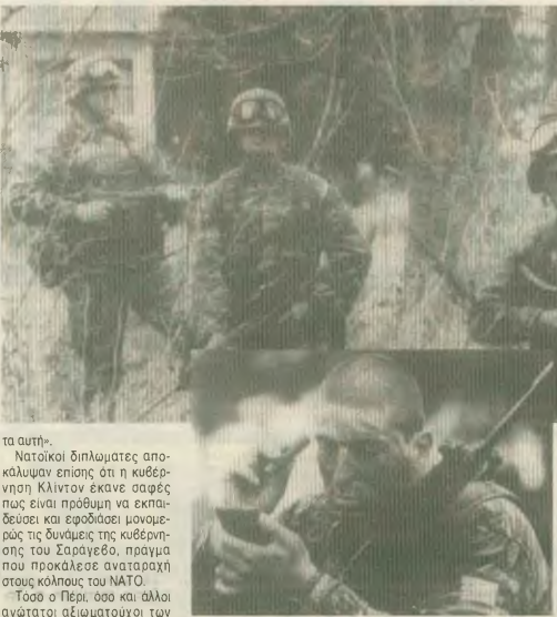
Στρατιώτες από την προετοιμασία των Ελλήνων στρατιωτών, λίγο πριν μεταβούν στη Βοσνία. Η ελληνική στρατιωτική επίκληση ήδη αρχίζει...

Αν επιπέσει η επίδειξη αυτή, όπως ο Πέρς, «ο ΗΠΑ, μαζί με άλλες χώρες, θα προχωρήσουν στη λήψη μέτρων, ώστε να διασφαλίσει η ανισότη-