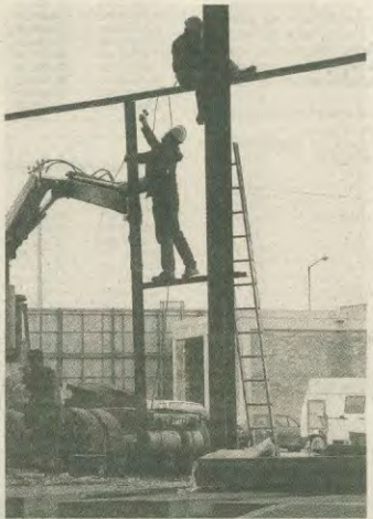
Αυτά δεν είναι μετρα ασφαλείας, συνάδελφοι. Έτσι βάζουμε σε κίνδυνο την ίδια μας τη ζωή...

μποκιά πόνεσα καθαρά και ξαστέρα: Οχι, δεν επιτρέπουμε σε κανένα να παίζει με την υγεία και την ασφάλεια μας. Και όπως λέμε: «νόμος είναι το δικαιο του εργάτη». Νόμος είναι το