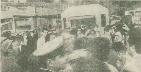
Απο παλιότερη κινητοποίηση

Για άλλη μια φορά η κυβέρνηση επιδειβάνει με τη στάση της ότι η ανεργία της πολιτική εφαρμόζεται σε όλη τη διάρκεια, ότι είναι υπέρτατη των ισχυμών, κα ότι η πολιτική της πολιτικής υπετέλεσε απάντη στις προκλήσεις και απελευτ, των Αμερικανών είναι επικίνδυνη για το λαό και τον τόπο. Στις 23 Ιουλίου το Συμβούλιο Επικρατείας αποφασίζει τη διάκριση της αμερικανικής πλοιοκτητικής εταιρείας του «Μάρκο Πόλο» καταργώντας με αυτήν του την άφραση στο καιμωτάζ και οδηγώ-