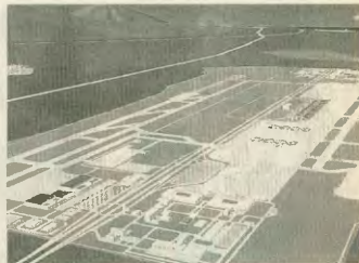
Οι Γερμανοί ξανάρχονται στο αεροδρόμιο των Σπάτων

φαρμογή των κονδύλων του Μάαστριχτ, άλλοι παραγωγικοί τομείς της χώρας θα έχουν οδηγηθεί στην καταστροφή και μια στρατιά αλόκληρη εργαζομένων στην εξοθώωση.