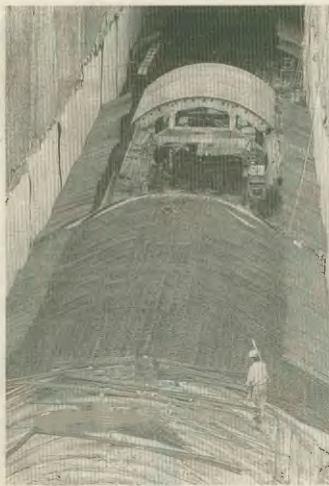
Το τούνελ του μετρό γίνεαι «παναγοικια»

Και δεν είναι μόνο αυτό. Ακόμη και άλλοι παραγωγικοί τομείς, που υποροδοούνται με σημαντικά κονδύλια από το Κανονικό Πλαίσιο Στήριξης, έχουν αφεθεί στην τύχη τους. Για παράδειγμα, το πρόγραμμα για τη βιομηχανία τη διετία 1994-1995, μόλις που κατάρτασε να απορροφήσει το... 2% των συνολικών κονδυλίων! Ένα άλλο παράδειγμα είναι αυτό της εκτροπής του Αχελώου - ενός από τα ελαχίστα μεγάλα έργα με αναπτυξιακό χαρακτήρα - που έχει κατανοηθεί «Γεωργία της Άρτας» και μάλιστα το περιμένουν οι κάτοικοι της Θεσ-