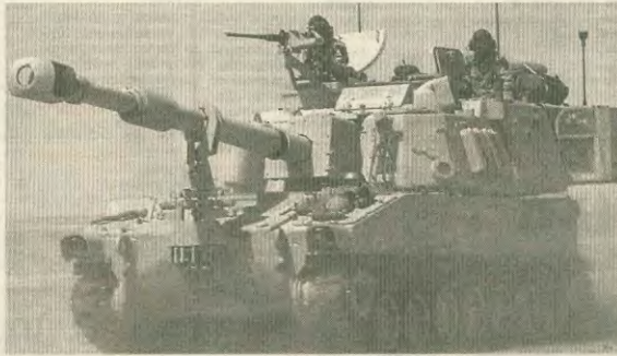
Τα αμερικάνικα τανκς καλούνται να επιβάλουν τη νέα τάξη σε όλο και ευρύτερες περιοχές της Ανατολικής Μεσογείου

ρό πρόσωπο των βομβαρδισμών στη Βοσνία, των επιβουλεύσεων στη Σομαλία και την Αιθιοπία, στην ετοιμότητα να επιβουλήν το θελήρη τους σκοτώνοντας.