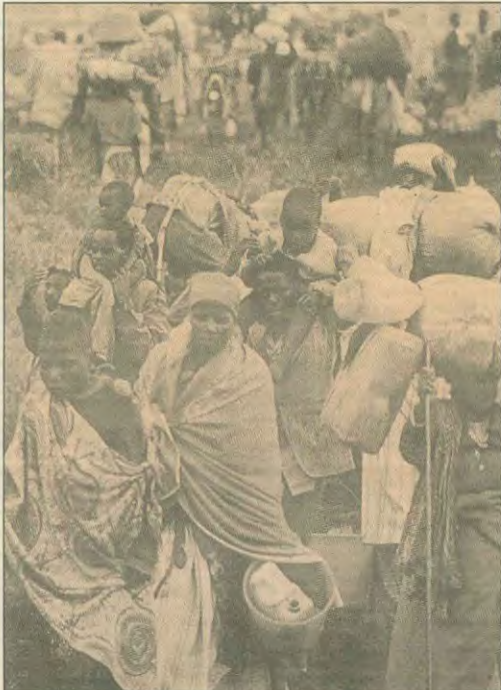
Προσφύγες Χούτου εγκαταλείπουν τα στρατόπεδα, στο Ανατολικό Ζαΐρ, μαζί με όσα υπάρχοντά τους έχουν απομείνει. Πολλών η τύχη παραμένει άγνωστη...

νους μισοδόφους και τα βελγικά στρατεύματα.