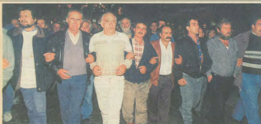
Από την πορεία διαμαρτυρίας το βράδυ μετά τη βομβιστική - τρομοκρατική επίθεση κατά των γραφείων του Συνδικάτου μας

Συγκέντρωση στην πλατεία Κάνιγγος, 9.30 π.μ.