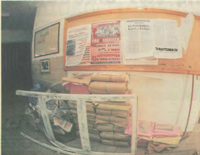
Αριστερά, η είσοδος των γραφείων του Συνδικάτου μετά την τρομοκρατική επίθεση. Δεξιά, η πορεία, το ίδιο βράδυ, από το τέλος αποραριστικής και

Αυτός ή αυτοί που τοποθέτησαν τον εκρηκτικό μηχανισμό, τα λίγα λεπτά της ώρας που δέδεσαν για να απομακρυνθούν χωρίς να γίνουν αποκαλυπτικά από τους ανθρώπους του κτήριου και του συνδικάτου, που εκκίνη την ώρα βρισκόνταν στην είσοδο, θέλασαν ότι ήταν άνθρωποι με πείρα, εκπαιδευμένοι, είχαν μελετήσει προσεκτικά και από καιρό την εγκληματική ενέργεια, ιδιαίτερα την ώρα που επέλεξαν να να δράσουν, λίγο πριν τις 8.00 το πρωί, όταν ο αρχέος συνθήκη ή κίνηση στο κτίριο, επιβεβαιώνει την