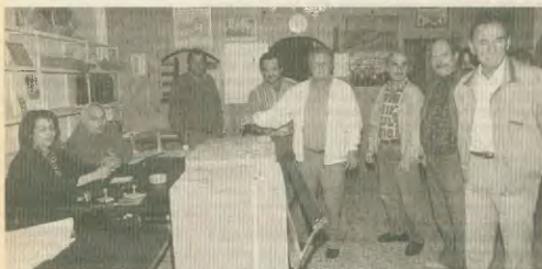
Επιβεβαιώθηκε η εμπιστοσύνη των οικοδόμων στην οργάνωσή τους

Το Συνδικάτο Οικοδόμων Αθήνας χαρακτηρίζει όλους τους αναθεωρημένους Οικοδομικούς, Χαρτεζί, όλους όσους υποβαλάν, ο καθένας να τον δικό του τρόπο, στη μάχη των εργαζομένων. Το συνδικάτο κέρδισε για μια ακόμη φορά τη μαζική συμμετοχή των οικοδόμων της Αθήνας. Επιβεβαιώθηκε και πάλι η εμπιστοσύνη και η εκτίμησή των οικοδόμων στην οργάνωσή τους. Στην οργάνωση που έβαλε μπροστά το πρόβλημα, καθοδήγησε και ανάπτυξε τον αγώνα για την επίλυσή τους.