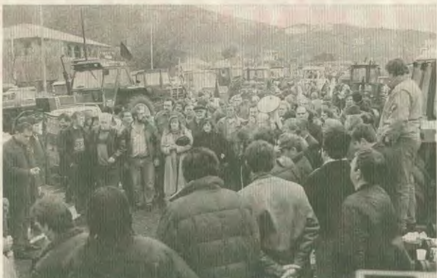
Οι οικοδομοί βρέθηκαν κοντά στις αγωνιζόμενες αγρότες

Οι πολυδυσφημίζοντες από την κυβέρνηση και τους λοιπούς ευρωπαϊστές «εταίρους» της Ευρωπαϊκής Ένωσης, στην πραγματικότητα επικυρίαρχοι της οικονομίας μας και στον αγροτικό τομέα ακολουθούν την τακτική που ακολουθούν για τη σωτηρία της βιομηχανίας, δηλαδή επιβλήνουν μέσα που όχι πολλά μέγανον τα εσοδα των αγρότων, αλλά καταστρέφουν στην ουσία το κμάκο και μεσα οικονομία, γιατί παράλληλα με μια σειρά περικοπές, η κατάργηση κάποιων μέτρων στέρησης που υπήρχαν για τις δυναμικές καλλιεργείες και την κτηνοτροφία, επιβάλλουν μειωμένες τιμές των αγροτικών προϊόντων, δραστηριοποίηση της παραγωγής και ταυχρονη αύξηση των καλλιεργητικών εσόδων (Αποδόματα, υποφοράκια, κάουμα, γεωργικά εργαλεία, κλπ).