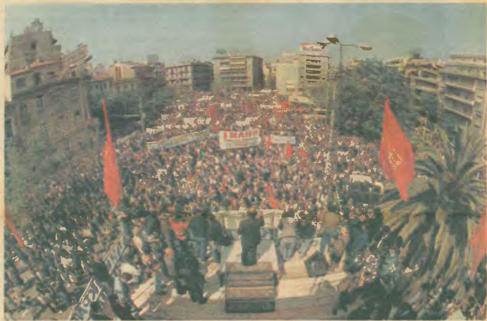
Από τη μεγάλη πρωτομαγιάτικη συγκέντρωση στο Πεδίο του Αρεως.

«Κόκκινη Πρωτομαγιά - πρωτοπόρα εργατιά». Το σύνθημα που κυριάρχησε στις συγκεντρώσεις και στις πορείες που ακολούθησαν. Σύνθημα «κλειδί», σύνθημα «κλειδί», που εκφράζει ακριβώς αυτό που έχει ανάγκη σήμερα ο τόπος. Την ενιαία, μαζική, αγωνιστική και οργανωμένη δράση όλων των εργαζομένων για την υπέρβαση της κρίσης. Επιβλητική — και αυτή τη φορά — η παρουσία των οικοδόμων. Στην Αθήνα με προσυγκέντρωση στην πλατεία Κάνιγγος, στο Πεδίο του Αρεως, στην πορεία στη Βουλή. «Πλή ταξική με συνέχεια και προοπτική». «1η Μην — ενότητα και πάλη ενάντια στον ιμπεριαλισμό. Ζήτω ο προλεταριακός διεθνισμός. Οι οικοδόμοι — αυτοί οι εργάτες του παρόντος και του μέλλοντος — στήσαν για άλλη μια φορά τα λάβαρα της ταξικής πάλης και ενότητας, τις κόκκινες σημαίες του σήμερα και του αύριο.