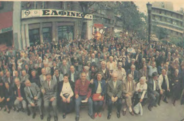
Απο τη συγκέντρωση στη πλατεία Κένυρας για τα 50 χρόνια απο την ίδρυση του εργατικού ΕΑΜ