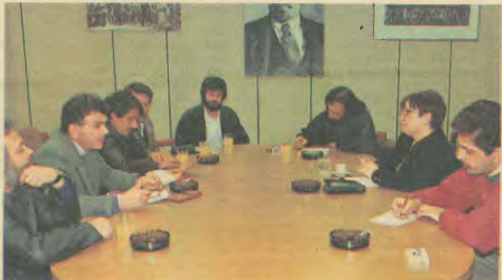
Από τη συνάντηση της αντιπροσωπίας του Συνδικάτου με τη ΓΓ της ΚΕ του ΚΚΕ Αλέκα Παπαρήγα.

Απαντώντας συνολικά η Α. Παπαρήγα, στόχεσε ιδιαίτερα στο θέμα των ξένων εργατών τονίζοντας ότι κυρίαρχο είναι να αντιμετωπιστεί το πρόβλημα των ίσων δικαιωμάτων και να αναπτυχθεί η συνεργασία με τους Έλληνες και τους ξένους εργάτες για καλύτερη και δημιουργική επικοινωνία, μέσα από την οποία θα προβάλλεται η ανάγκη της πολιτικής τάξης και θα αναπτύ-