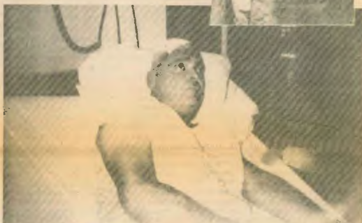
Ο Ουέιν Μακκλάρνεν έγινε γνωστός σαν ο «άνδρας του Μάρλμπορο». Τον περασμένο Ιούνη έχασε τη μάχη με τον καρκίνο

Παρά όλα αυτά η διαφήμιση των ταϊγάρων εξακολουθεί να απαιτεί δημοσιογραφία για τους επιχειρηματίες, χωρίς οι κυβερνήσεις να παίρνουν έστω και κάποια στοιχειώδη μέτρα. Η αμερικανική κυβέρνηση δεν έχει ερευνηθεί το θέμα των προϊόντων καπνού και οι βιομηχανίες εξακολουθούν να διαφημίζουν το ταϊγάρο ως διεγερτικό, μοντέρνο και ωφέλιμο. Η Ελλάδα και άλλες τέτοσις κοινοτικές χώρες δεν έχουν εκφράσει οφθαλμική άποψη για την πρόταση της Ευρωπαϊκής Επιτροπής να απαγορευθούν όλες οι διαφιρηνικές προϊόντων καπνού, αν και σχετική έρευνα δείχνει ότι το 64% των καπνιστών και το 78% των μη καπνιστών στην Ευρώπη θέλουν να απαγορευθούν οι διαφιρηνικοί ταϊγάροι. Στην Ελλάδα το 79% είναι υπέρ της απαγόρευσης και μόνο το 14% κατά.