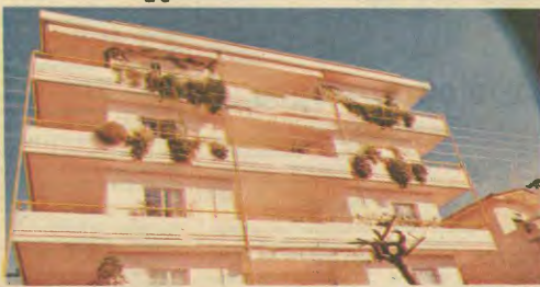
Μέχρι και 223% ανατιμήθηκαν οι αντικειμενικές αξίες με τις προηγούμενες αυξήσεις. Τώρα η κυβέρνηση θέλει να τις αναβάσει περαιτέρω

Οι προηγούμενες αυξήσεις που επιβλήθηκαν το Γενάρη του 1991 έφτασαν μέχρι και 223% στην περιοχή της πρωτεύουσας. Ανάλογη ήταν τότε και η αύξηση του φόρου μεταβίβασης. Μικρότερες ( ) ήταν οι αυξήσεις σε άλλες περιοχές της χώρας, από έξερπνεύον το 100% συγκριτικά με τις προηγούμενες. Και να παρομοιούση μια ότι όπως αποστράγγει η κυβέρνηση οι αντικειμενικές αξίες, θα πρέπει να αναπροσαρμό-