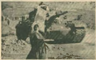
Βαριά όπλα μάχης χρησιμοποιεί ο τουρκικός στρατός στις επέσεις κατά των κομηδικών χωριών

τους ναζί, των μαύρων από το απορτήν; Τηρούμεν πάντα τον αναλογιστή και εκεί για κοινωνική ιεράρχηση δεν μιλούσαν; Αυτή δεν ήταν η φιλοσοφία τους; Μηπως και οι νεοναζιστές σήμερα στη Γερμανία και άλλες χώρες με την ίδια «λογική» δεν επιτίθενται σε μετανάστες; Μηπως και τους Παλατινοί τους με τον ίδιο τρόπο δεν τους αντιμετώπιζον οι Ισραηλινοί ονιάδες; Η τους Κούρδους οι Τουρκοί και οι Ιρακίνοι; Τους οποίους με τη σειρά τους τους περιμηνουν οι Λευκοί - Ευρωπαίοι ρατσιστές; Τους οποίους σαν μετανάστες τους περιμηνουν για «φιλοφρονήσεις» οι φοιτιστές της Γ Ελλάδας και της Γερμανίας; Ξεχάσαμε δηλαδή την επίθεση στο ελληνικό σχολείο από τους Γερμανούς νεοναζιστές; Ο φαύλος κύκλος του ρατσισμού και της ξενοφοβίας δεν έχει τελειώσει. Οποιος μίπλεκεται στην γρανάζια του σαν βύτης σε είναι αισιμικός ότι θα αποτελέσει το επόμενο θύμα.