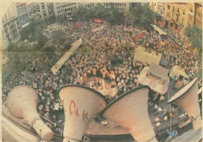
Κόλλεσμα της Διοίκησης του Συνδικαίου για την απεργία στη σελ. 3

Ποια ψηφίσματα εγκρίθηκαν και τι αναφέρουν ΣΕΑ. 3