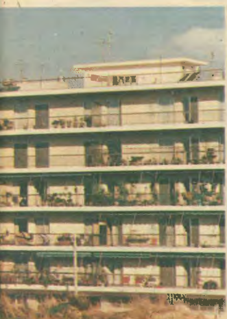
Η κατάργηση των ελέγχων και την απελευθέρωση