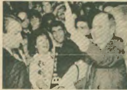
Ο τον και ο επίσημος αθηνάγης. Το καθεστώς της νέας τάξης πραγμάτων που και οι ίδιοι αποδέχονται, στηρίζουν και υλοποιούν δεν αφήνει περιθώρια αξιοπιστίας για τους λαούς του κόσμου

διασφάλιση που εκδηλώθηκε με ηπιες και άγριες μορφές, όπως στο Λος Άντζελες. Έτσι πρόβλεπε σε δεύτερη μοίρα οι βραχυβόλοι της Μπους για τη «νέα τάξη» και την κατάρρευση του «αντιπαλιού δόξου». Τα θέματα της εξωτερικής πολιτικής πέσαν στο περιθώριο, αφού πλέον δεν υπήρχε αντίπαλος.