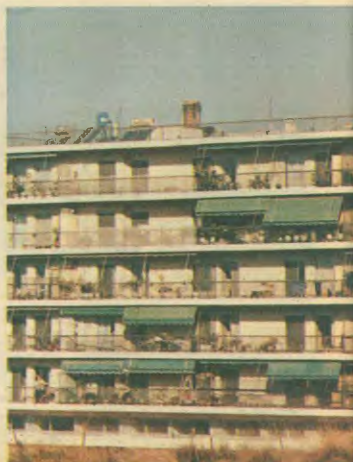
Στα ύψη εκτινάχθηκαν οι τιμές των οικοδομικών υλικών με τις αγορές

Κατά 132% έχει αυξηθεί η τιμή του έτοιμου σκυροδεμάτος στο διάστημα 1990-1992, σαν αποτέλεσμα της απελευθέρωσης της τιμής των οικοδομικών υλικών. Η φοροεισπρακτική μανία της κυβέρνησης εκτινάσσει στα ύψη τις τιμές των ακινήτων