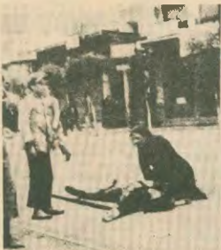
Μαΐος του '36 στη Θεσσαλονίκη