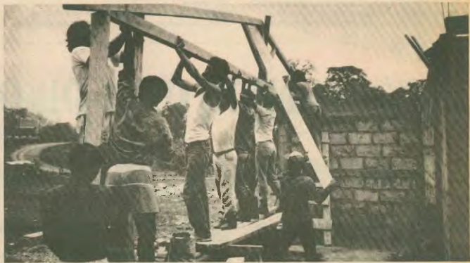
Ελληνες οικοδόμοι χτίζουν σχολείο στη Νικαράγουα

Τελικά έγιναν οι εκλογές με τηρήση των όρων συμφωνίας μόνο από την πλευρά των Σαντινίστας. Με τους Αμερικάνους να συνε-