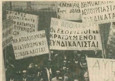
Πρωτομαγιά του 1957

Ευρώπη. Οι εργαζόμενοι μετατρέπουν τη μέρα σε μεγάλο αντιφασιστικό συλλαγή.