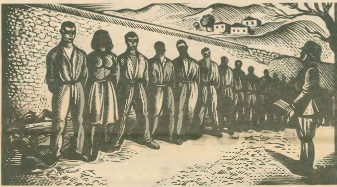
Πρωτομαγιά του 1944

1η ΜΑΗ 1934: Σ' όλες τις μεγάλες πόλεις κηρύσσονται 24ωρες απεργίες. Ο φασισμός ακιλόβητα τη χώρα και την