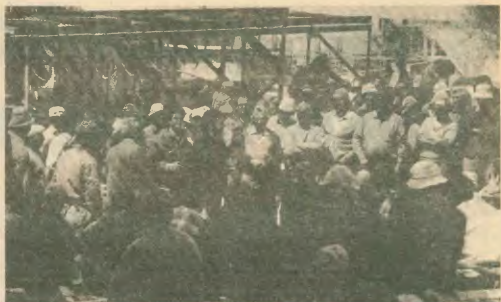
Πρωτομαγιά '90. Ο πρόεδρος του Συνδικάτου μιλάει σε οικοδόμους κατά τη στάση εργασίας