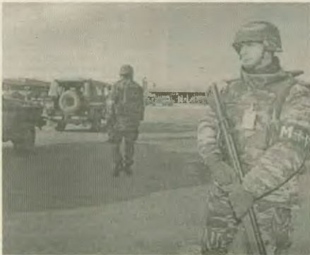
Ελληνες στρατιώτες (αριστερά) στο Κοσσυφοπέδιο, μαζί με τους Αμερικανούς (δεξιά) στη ΝΑΤΟική «ενημερωτική δύναμη»