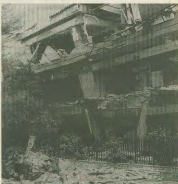
Καταστραφένια σπίτια της περιοχής, που έληξε ο σεισμός της 7ης Σεπτεμβρίου 1999

περιφέρει είναι το σπίτι τους που καταστράφηκε. Θα φέρνουν τα δικαιολογικά τους στα κεντρικά γραφεία του Συνδικάτου, στην οδό Βερανζέρου 1, Πλ. Κάνιγγος, τις ώρες 8.00 π.μ. έως 3.00 π.μ. και θα τα παραδώσουν μόνο σε υπαλλήλους του Συνδικάτου.