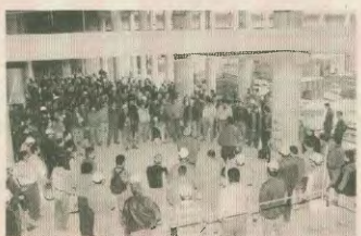
Από τις εξομρήσεις στα εργατόβια για τη μάχη για το Ασφαλιστικό

Η Επιτροπή Αγώνα εκτιμά ό,τι το εργατικό συνδικαλιστικό κίνημα της πατρίδας μας έχει την ικανότητα να δημιουργήσει τις προϋποθέσεις, ώστε να οργανώσει ένα ΑΓΩΝΙΣΤΙΚΟ ΤΕΛΟΣ απέναντι στην καταβύθιση και τους βουτηγμένους Ομίλους, για να είναι αποτελε-