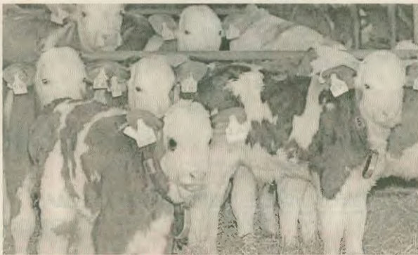
Μοσχαράκια σε φάσμα της Γερμανίας «μικραρισμένα» ότι έχουν μολυνθεί από τη νόσο των «τρέλων αγελάδων». Προσομοίωσ τους έτσι οι σφαγεία

Ο αγώνας δρόμου για το κέρδος μέσα από τη μείωση του κόστους παραγωγής έφερε τα πάνω κάτω στον τρόπο εκτροφής των ζώων, που τώρα εκτρέφονται με κρεατάλευρα που προέρχονται από απόβλητα σφαγίων και βιομηχανικών κρέατος, καθώς και άρρωστων και ψόφωτων ζώων.