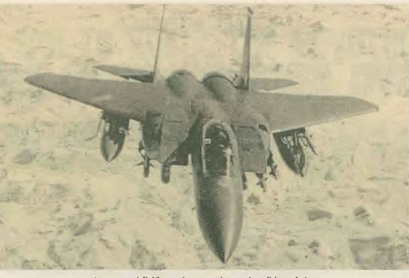
για Αμερικάνο F-15 υπερσφαιρικά πάνω από το Βόρειο Ιράκ, όπου να επιβάλει το «νέο του ισχυρού» στην πολιτική ζωή.

Ο κλιμακωτικός σχέσεις ουσιαστικά από την επιθυμία του Πενταγώνου. Πάρε τις κεντρικές διαμορφώσεις, περί συνεργασίας Η-