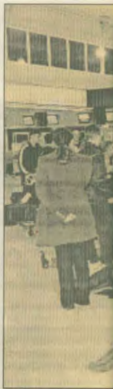
Κατά τη διάρκεια της κατασκευής του αεροδρομίου η κυβέρνηση έστειλε στο εργοτάξιο ακόμη και τα ΜΑΤ, για να ηττηθεί η εμεταλλεντική μανία των εργοδηγών

μεταλλεύεται η πολυεθνική γερμανική εταιρεία ΧΟΧΤΙΦ. Ετσι προβλέπει η αποικιοκρατική σύμβαση που υπέγραψε η κυβέρνηση.