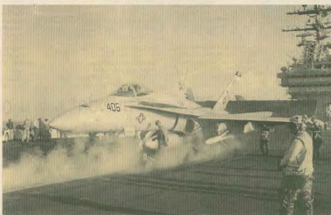
Μήνα αντιπολεμικής δράσης κήρυξε το Μέσο η ΕΕΛΥΕ και καλεί σε αντίσταση στα σχέδια των ιμπεριαλιστών για την περιοχή των Βαλκανίων

Εύλογα τίθεται το ερώτημα: Φρακτώστε, λοιπόν, από πρόθυμο ενός γιουγκοσλαβικού πολέμου; Βεβαίως, η απάντηση δεν μπορεί να δοθεί αποκλειστικά με ένα ή να είναι όχι. Αυτό όμως που σίγουρα είναι πραγματικό, είναι ότι ο πόλεμος στα Βαλκάνια συνεχίζεται, ότι η ΝΑΤΟϊκή κατοχή και παρουσία ανδρείων νέων φανταί, που απίθανοι συνεχώς και απειλούν με μια γενικότερη ανάφλεξη της περιοχής. Το σχέδιο ναύς διακρίνει τη Γιουγκοσλαβία βλοκωμένη σε εξέλιξη και οραρού το Μαυροβούνιο, τη Βοσνίαντα, η ένωση στην ΠΓΔΜ βουλγαλικά και δημοκρατία θεμάτων αναδιανομής