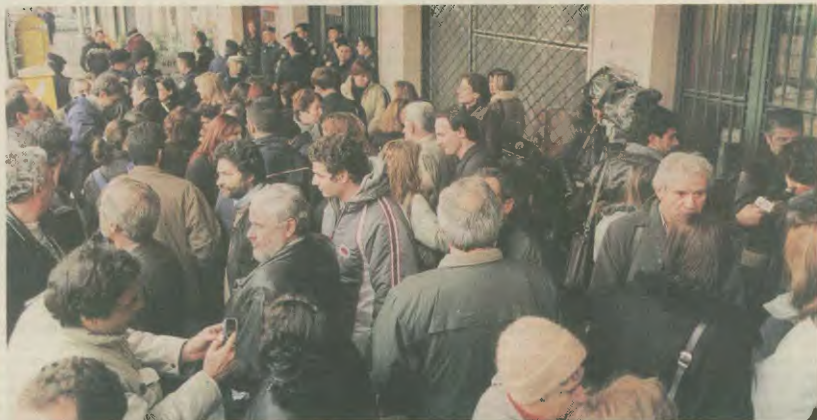
Από την πρόσφατη δυναμική και άμεση παρέμβαση που έκαναν συνδικαλιστές και συνδικαλιστριες, στο υπουργείο Εργασίας, διαμαρτυρούμενοι για τα κυβερνητικά σχέδια αύξησης των ορίων ηλικίας συνταξιοδότησης των γυναικών, στο όνομα της ισότητας των δύο φύλων

Συνάδελφοι, με την ευκαιρία των εορτών, η διοίκηση του Συνδικάτου μας, εύχεται σε όλους τους συναδέλφους και τις οικογένειές τους ΧΡΟΝΙΑ ΠΟΛΛΑ, ειρηνικά, δημιουργικά και καλούς αγώνες