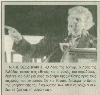
ΜΙΚΗΣ ΘΕΟΔΩΡΑΚΗΣ: «Ο Λαός της Αθήνας, ο Λαός της Ελλάδας, πιστός στις εθνικές και ιστορικές του παραδόσεις, διαλέγει για άλλη μια φορά το δρόμο της αντίθεσης προς τους ισχυρούς που σκοπούν βία και θάνατο. Διαλέγει το δρόμο της υπερασπίσης του δικαίου μας των λαών να ορίσουν οι ίδιοι τη ζωή και τη μοίρα τους».