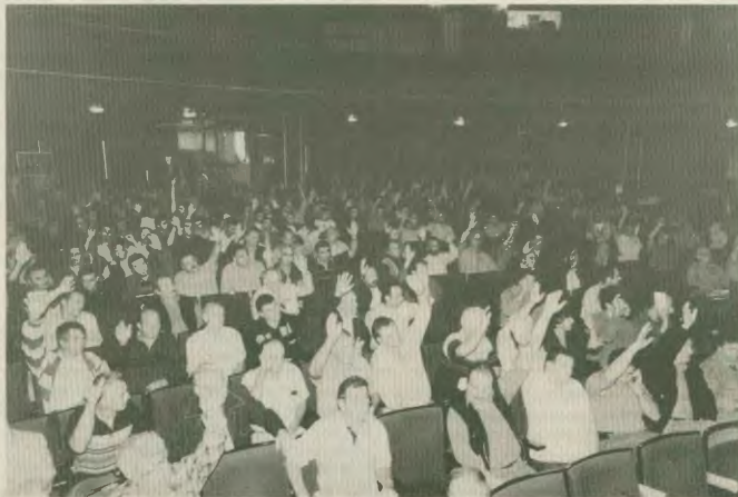
Άποψη από τη μαζική γενική συνέλευση του Συνδικάτου Οικοδόμων Αθήνας, στις 21 Οκτώβρη 2001

Σ' αυτά τα προβλήματα το μόνο «φάρμακο» είναι ο πόλεμος, η αναίτηξη νέων αγορών, μαζί με τη μαζική και ταστροφή προϊόντων και παραγωγικών δυνάμεων. Είναι καιείς τόσο αφελής, που να μην αντιμωβριζόμαστε ότι πίσω από την υποκριτική κραυγή περί τρομοκρατίας βρίσκεται η διεκδικήση εδαφών, η δίψα για κατοχή των υποδαφών, των πετρελαίων, ο έλεγχος των παραγωγών, των σταθμών μεταφοράς, αλλά και η παγκόσμια κυριαρχία των ιμπεριαλιστών της γεωστρατη-