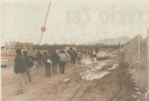
Μέσα από λασπόνερα και μετά από ποδοδρόμιο δύο χιλιόμετρα μπορείς να φθάσεις στο χώρο εργασίας σου