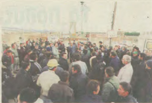
Συζήτηση των εργαζομένων με την αντιπορευότητα του Συνδικάτου

Μ εσάφηση της Διοίκησης του Συνδικάτου δημιουργήθηκε το Παράρτημα Εργαζομένων στο Ολυμπιακό Χωριό.