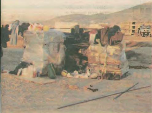
Η ανθρώπινη ζωή. Κάτω, οι χώρες που αλλάζουν οι εργαζόμενοι στο Ολυμπιακό Χωριό

φροντίσει ώστε οι κοινοπραξίες να «μη ενοχλούνται», επειδή παραβιάζουν την εργασιακή, ασφαλιστική νομοθεσία και τους κανόνες των μέτρων ασφαλείας και υγιεινής της εργασίας. Η Επιθεώρηση Εργασίας της Ανοίξης έχει ουσιαστικά μόνο τρεις υπαλλήλους που μπορούν να ελέγξουν την τήρηση του ωραρίου και των αργιών σε περίπου 6.000 επιχειρήσεις (ανάμεσα τους και το ΟΧ). Η αρμόδια υπηρεσία του ΙΚΑ που ελέγχει την τήρηση της ασφαλιστικής