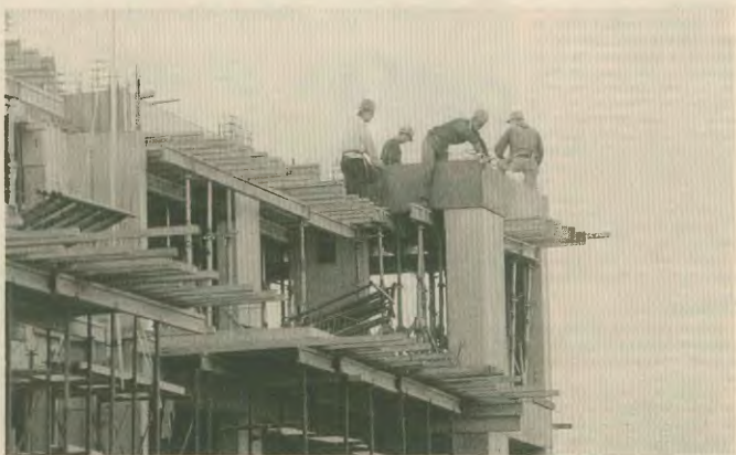
Αυτό είναι τα «ελαφριά» επαγγέλματα που κυβέρνηση και εργοδότης έχουν βάλει στο στόχαστρο

Κάτω από τη θωρακισμένη αντίσταση του συνδικαλιστικού κινήματος, η επιτροπή αυτή ανήγγειλε ουσιαστικά να γνωμοδοτήσει για τον αποχαρκτηρισμό επαγγελματιών, αφού δε διέθετε στοιχεία (π.χ. μετρήσεις βιοχημικών παραγόντων, επιδημιολογικά στοιχεία νοσηρότητας, επεξεργασία των στατιστικών στοιχείων των εργατικών συγχρωμάτων και επαγγελματικών ασθενειών κ.ά.).