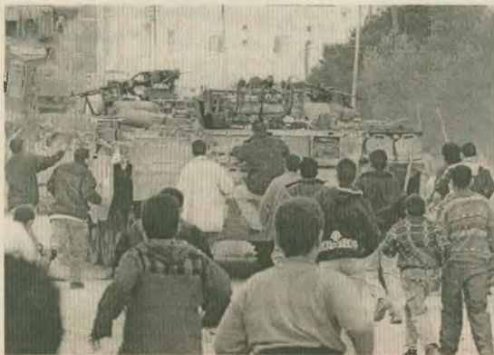
Την απόφασή τους να συνεχίσουν τον αγώνα μέχρι τη δικαιοσύνη, δηλώνουν οι Παλαιστίνιοι νεολαίοι

Ε ίμαστε αλληλέγγυοι με τον αγώνα των Παλαιστίνιων, γιατί είναι ένας αγώνας δικαίος. Ένας αγώνας για το δικαίωμα ενός λαού να έχει δική του πατρίδα.