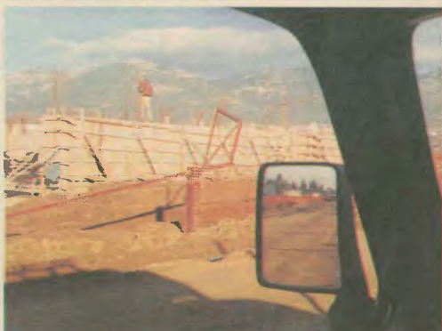
Οι αναλωτές «αποξηλώνουν» αφηρή, ως πληρωθούν οι εργαζόμενοι με τη ζωή τους

2001, Αναλυτικά, η Α' Κοινοπραξία αποτελείται από τις τεχνικές εταιρείες ΕΛΛΗΝΙΚΗ ΤΕΧΝΟΔΟΜΙΚΗ ΑΕ, ΑΛΤΕ ΑΤΕ και ΓΕΚΑΤ ΑΤΕ που έχουν αναλάβει την κατασκευή 555