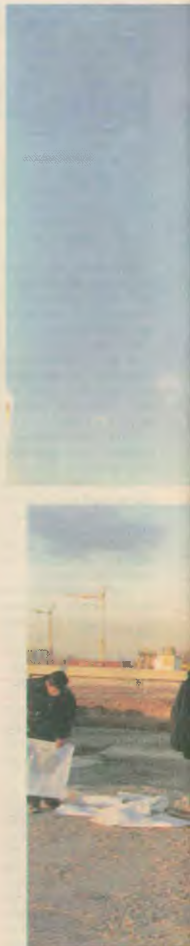
Αφηράτικα με αντίλληλα

Ανάλογα πριμ ισχύουν για την 5η μέχρι και την 9η προθεσμία (εκτός της 7ης). Ειδικά, για την 7η και την 9η προθεσμία προβλέπεται αυξημένο πριμ 10.000.000 δραχμών ημερησίως. Με άλλα λόγια η κυβέρνηση πριμοδοτεί μέχρι και 4.200.000.000 δραχμές συνολικά τις κοινοπραξίες για να τελειώνουν νωρίτερα το έργο. Για να γίνει αντιληπτό το μέγεθος του πριμ αναφέρεται ότι αν οι κοινοπραξίες ολοκληρώσουν τις φάσεις του έρ-