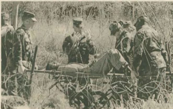
Αλυποδόμενους ως φορείς μεταφύρων των κρατούμενων Αφγανούς οι στρατιώτες της υπερδύναμης

Την ίδια στιγμή οι Ευρωπαίοι σύμμαχοι των ΗΠΑ διαμαρτυρούν τον κανό εγκληματικό από τον