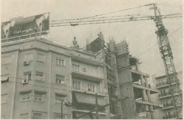
Ο κίνδυνος παραμένει στα 30 μέτρα ύψος που βρίσκεται ο συνάδελφος, γιατί ζούμε στην πηχώς σε νεοεγχευμένη οικοδομή στη Βασ. Σοφίας, κατά νύκτα στην πλατεία Μαβίλη. Το κλεινό θα πέσει. Μα ο συνάδελφος δεν ξαναγεννιέται...

Γιατί οι κατ' επανάληψη κυβερνητικές ενέργειες αποδείχθηκαν μέχρι τώρα υ-