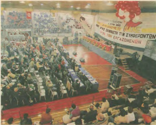
Από την έναρξη της Συνδιάσκεψης