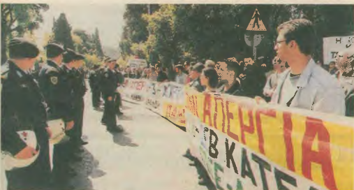
Κόντρα στην κριτική καταστολή

«Θέλουμε, είπε, τα συνδικάτα που μετέρχον στο ΠΑΜΕ να είναι το θετικό παράδειγμα για όλο το συνδικαλιστικό κίνημα». Κάλυψε τους αντιπροσώπους να συμβάλλουν στο παραπέρα άνοιγμα των σωματείων, στο ζωντάνα της λειτουργίας τους.