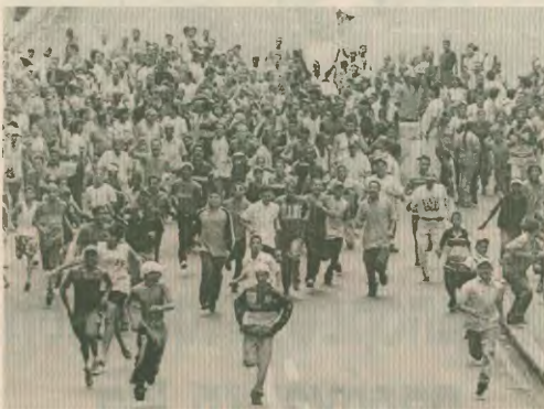
Ο λαός της Βενεζουέλας στανς δρόμους

Οι πρόσφατες συνταραχτικές εξελίξεις στη Βενεζουέλα έδωσαν σε όλους μας ένα κοινό μάθημα. Μέσα σε 48 ώρες, ο Ούγκο Τσάβες, ο εκλεγμένος με μεγάλη πλειοψηφία Πρόεδρος της χώρας, που μέσα σε τρία χρόνια είχε αναδειχτεί νικητής σε 9 διαφορετικές εκλογικές διαδικασίες, αντικαταστάθηκε από έναν βιομηχανο, συνελήφθη, μεταφέρθηκε φρουρούμενος σε στρατιωτική βάση, και επανήλθε στη θέση του ύστερα από μεγάλες λαϊκές κινητοποιήσεις