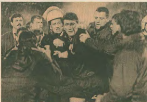
Ο διατητής φεύγει από το γήπεδο μετά την «περιοχή» από τους χουλιγκάνους

Η διεύθυνση αυτών των πολυεθνικών και ισχυρών οικονομικών παραγόντων, έχει ως αποτέλεσμα την επιβόλη αλλαγών και στον τρόπο διοργάνωσης τόσο των εθνικών πραιοθλημάτων