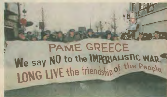
Στὴ διαδήλωση στὴς Βρυξέλλες

— Στὰ μεγάλα συλλαλητήρια καθε Σεπτέμβριο στὰ ἑκαθῶν τῆς ΔΕΒ με τὸ λαϊκό σῶσιμα καὶ τῆς συμβολικῆς ἐκδηλώσεως.