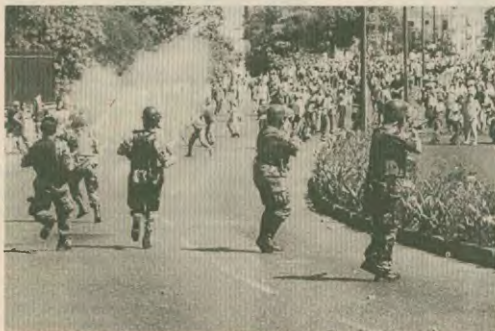
Ο στρατός απαντά με πυρά κατά των διαδηλωτών

Η Βενεζουέλα χωρίστηκε στα δύο. Από τη μια ο απλός κόσμος, ο λαός που πλημμυρίζει καθημερινά τους δρόμους διαδηλώνοντας «Δε θα θανατωθούμε», κι από την άλλη όλοι όσοι είχαν κάποια από τα προνόμια τους.