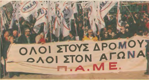
Μαζί με τους αγρότες

ντηποποίησης, στις οποίες ήταν αδελφική η συμμετοχή της νεολαίας, εδωξαν μια φρεσκάδα και ένα νεύρο, που τα τελευταία χρόνια είχαν υποχωρήσει μέσα στο συνδικαλιστικό κίνημα.