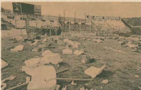
Εκίνα καταστροφής σε ελληνικό γήπεδο

όσο και των ευρύτερων ευρωπαϊκών και παγκόσμιων διοργανώσεων. Είναι τέρπια το κέρδη που αποκομίζονται τα ομαστέα, που ομαστέα-ται στη διοργάνωση του Champions League. Βέβαια, κανείς δεν αντέχει ότι η διοίκηση είναι θεμπί, αλλά πρέπει να συμφωνήσουμε επίσης ότι αυτά τα κέρδη ποσά είναι το βασικό κίνητρο που «σπρωχνεί» τους ενδιαφερόμενους μεγαλοεπιχειρηματίες και τις ομαδες που αυτοί ελέγχουν, προς την κατόκτηση των τίτλων και άλλων διοικήσεων στη χώρα τους.