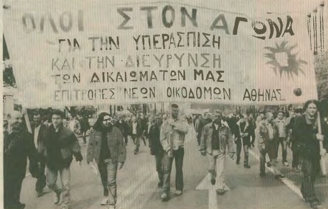
Από την πορεία, μετά τη συγκέντρωση, στις 3 Απριλίου

Ο αγώνας του σήμερα, το α-νεξάρτητο της μαζικότητας αυ-τών των αγώνων είναι παρακα-ταθήκη για τους αγώνες του αύριο, για τους αγώνες για την υπερασποση και διεύρυνση θε-μελιωτικών κατακτήσεων και δι-καιωμάτων.