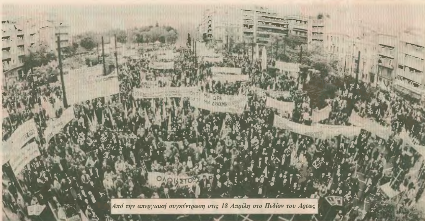
Από την απεργιακή συγκέντρωση στις 18 Απριλίου στο Πεδίον του Αρεως

Καταλαβαίνουν ότι μόνο αν προχωρήσουν και άλλο στην έ-