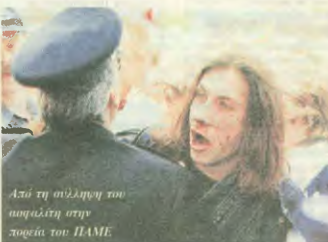
Από τη σύλληψη του πρωτοπλήτη στην πορεία του ΠΑΜΕ

Η νέα επικίνδυνη ενέργεια δόξωη την αντίθεση της όπ το διασφωμι-νο εργάτικο κίνημα ενόπιον στην ο-