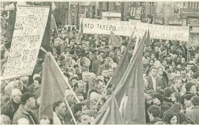
Οι εργαζόμενοι θα πρέπει να ενισχύσουν εκείνες τις δυνάμεις που αντιστάθηκαν στην αντιλαϊκή πολιτική και συντάχτηκαν με το λαϊκό κίνημα