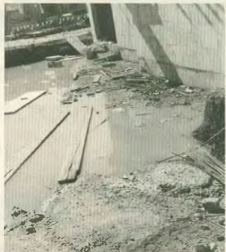
Αριστερά: Ο συνδελός σκαφαλωμένος οαν χυμιάτης σε ύψος 5 μέτρων. Επάνω, απαράδεκτες συνθήκες εργασίας στο Ολυμπιακό Χωρό

ρεπτικά επικινδύνων συνθηκών για τη ζωή τους.