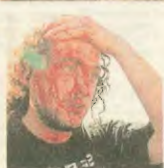
Με αποφασιστικότητα μαρτυρά στην αυτονομική βία