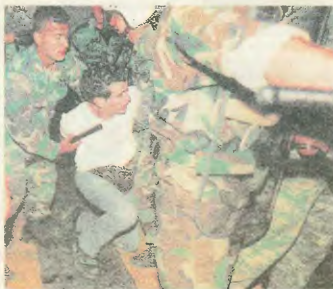
Φωτογραφίες - ντοκουμέντα της αστυνομικής βλαβερότητας

καταστολής, που χτύπησαν με υίσιος χτύπησαν για να σκοπεύουν τους εργαζόμενους για να σκοτώσουν.