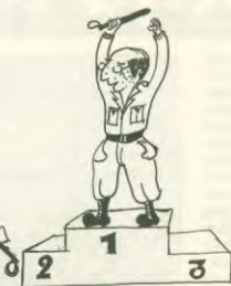
ΠΡΟΚΡΙΜΑΤΙΚΟΙ ΚΑΤΕ ΟΛΥΜΠΙΑΚΕΣ ΑΣΤΙΝΗΣ 2004 Πρωτ: Κυθέρνη, 47 νευτεργατές στο νοσοκομείο Το ΒΡΑΒΕΙΟ ΑΠΟΚΡΙΒΕΙ Ο ΕΦΟΡΜΗΤΗΣ ΑΣΤΙΝΗΣ