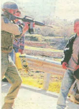
Με το μαυρί στα χέρια τρέχει να γλιτώσει από τη δολοφονική μανία των Ισραηλινών

πικανών. Γέκτο κι αυτοί αποκλεισμένοι με τις κόνες των όπλων του στρατού και το μίσος των εβραίων να τους σπρωβούν και να σκοτώνουν μια — μια τις χερές με τις χερές τους.