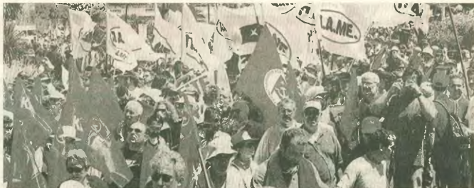
«ΔΡΑΣΗ: ΘΕΣΣΑΛΟΝΙΚΗ 2003»