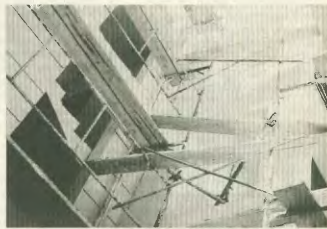
Σκαλωσιάς από εργασίες επιτηρημένου υπεργολάβου στην Β' Κ/Ξ στο Ολυμπιακό Χαριό