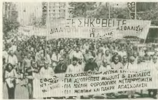
Από συγκέντρωση του ΠΑΜΕ για το Ασφαλιστικό

Στις 21 Ιουνίου, λίγες μέρες μετά την απεργία, αντιπροσωπευτικά του ΠΑΜΕ διαδήλωσε μαζί με χιλιάδες διαδηλωτές εργάτες στην Πανευρωπαϊκή διαδήλωση της Σεβίλλης, ενάντια στην αμερικανική πολιτική του κεφαλαίου και της Ευρωπαϊκής Ένωσης. Την ίδια μέρα, πάλι το ΠΑΜΕ οργάνωσε την αλληλεγγύη των εργαζομένων προς τους απεργούς ναυτεργάτες με μεγάλο περνερατικό συλλαλητήριο στο λιμάνι του Πειραιά. Κατάδικος έτσι τον σε βάρος τους φασισμό της πολιτικής επιστράτευσης, που κηρύξε η κυβέρνηση μαζί και από τη δολοφονική επίθεση που είχε εξαπέλυσει εναντίον τους μαζί με τους εργολήπτες, στην απεργία τους, στις 29 Μαΐ. Σ' αυτό το ζήτημα, που έχει ευρύτερη