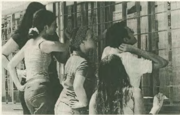
Η ώρα των αποτελεμάτων και η αγωνία των παιδιών

Η μεθόδογία για την αυβλήνωση των επιπτώσεων του εξεταστικού συστήματος μετά από τις τροποποιήσεις του Ευθυμίου, μαζί με τη γενική ευωροπία που τη συνοδεύουν, διαβλάνονται από τα αποτελέσματα αυτά, αλλά και από άλλες θεμελιώδεις, αλλά άγνωστες πτυχές