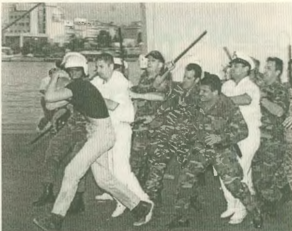
Ιδιού οι τρομοκράτες της κυβέρνησης

Έμιασε περήφανα γιατί αυτά τα παιδιά που αιχμαλωτίστη, τους δολοφονικούς, κρατικούς μηχανισμούς μπαίνουν βαρύτερα στο κείμενο της ταξικής πάλης, γνωρίζοντας ότι το ανάθεμα στον καταπέλτη είναι το ανάθεμα σε όλους ακολούσι τη μεγάλη σκάλα