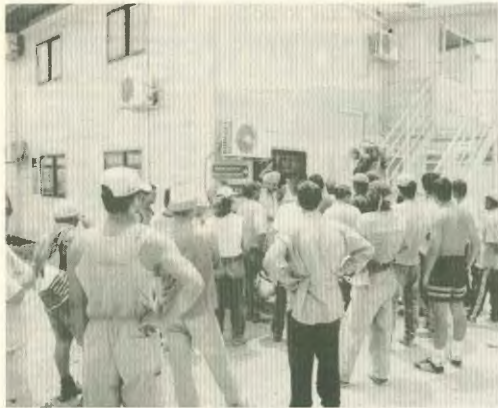
Ολυμπιακό Χαριό: Πρώτη άμεση απάντηση στα γραφεία της Γ Κ/Ξ για τον τέτατο νεκρό συνάδελφο

Οι 4 νεκροί, οι 7 σακατεμένοι, και οι εκατοντάδες τραυματισμένοι εργαζόμενοι είναι ο βαρύς φόρος αίματος, που πληρώνει η εργατική τάξη στο βωμό του κέρδους της εργοδοσίας, στο Ολυμπιακό Χαριό