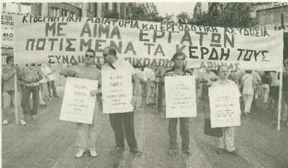
Η δικτατορία της 17 Αυγούστου, στο κέντρο της Αθήνας

Δεν είμαστε «καύσιμη ύλη» για την αύξηση των κερδών της εργοδοσίας. Αυτή η βάρβαρη πραγματικότητα πρέπει να λάβει τέλος τώρα!