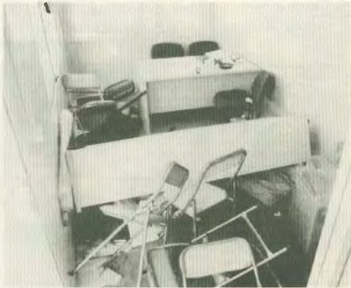
Εσωτερικά τα γραφεία του παρατηρητά στο Ολυμπιακό Χαριό, μετά την επίθεση που δέχτηκαν με μηχανήματα έργων στις 8 Ιουλίου

Τ α πολλά και σοβαρά ατυχήματα που γίνονται στο εργοτάξιο - κότεργο του Ολυμπιακού Χαριού, δεν προκλούνται από απρόβλεπτα και αναπόφευκτα γεγονότα, ούτε βέβαια είναι της μοίρας γραφτό να σκοτώνονται και να σακατεύονται οι οικοδόμοι, για να μη χτιστούν τα σπίτια, όπου θα περνούν οι αθλητές που θα πάρουν μέρος στην Ολυμπιάδα του 2004.