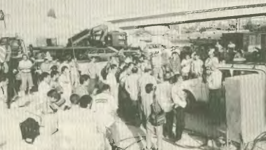
Από κινητοποίηση στο εργοτάξιο της Αττικής Οδού, στο Χαλάνδρι

ΣΥΝΤΟΝΙΣΤΙΚΟ ΣΩΜΑΤΕΙΟ ΣΥΝΔΙΚΑΤΩΝ & ΣΥΝΔΙΚΑΛΙΣΤΩΝ ΑΘΗΝΑΣ. ΓΛΑΥΚΟΠΛΩΣ 3 - ΣΤΟΑ ΦΕΗ. ΑΘΗΝΑ