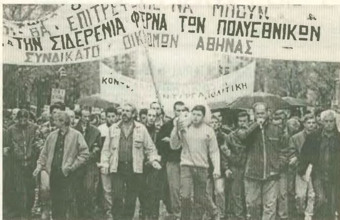
Λεξία, στιγμιότυπο από μεταγωγή κατοκόμενων μελών της «17N» στον Κορυθαλά. Η άρχουσα τάξη προσπαθεί, χρησιμοποιώντας ως πρόχημα την κατεχθινόνη τρομοκρατία, να συνκοτηνήσει τους λαϊκούς αγώνες

Η αναλαϊκή πολιτική όζει να προβλήσει, αναπυσο-