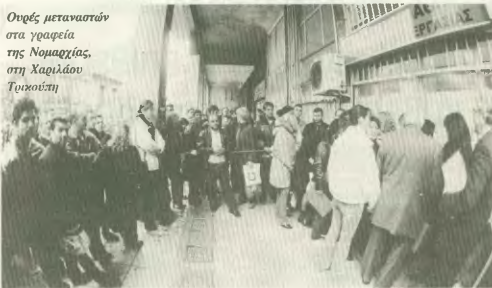
Ομάδες μεταναστών στα γραφεία της Νομαρχίας, στη Χαριλάου Τυχοκλήτη