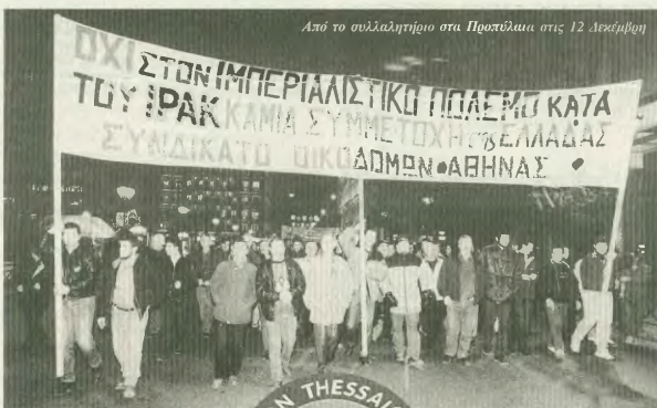
Από το συλλαλητήριο στα Προπύλαια στις 12 Δεκέμβριο

Αυτές τις ημέρες η ελληνική κυβέρνηση ανέλαβε την προέβρα της ΕΕ για το πρώτο εόρμητο του 2003 και η οποία θα καταλήξει με τη Σύνοδο Κορυφής το καλοκαίρι του ίδιου χρόνου απ' Θεσσαλονίκη, όπου θα δρομολογηθούν νέα αντεργατικά και αντιστατικά μέτρα. Στοι μεσοδιάστημα θα οργανωθούν συσκέψεις υπουργών της σε διαφόρες περιο-