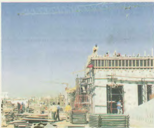
Φίλημο: Από εξόμηση, για τη συμμετοχή των συνδικαλίων στις εκλογές

γιστικών Γενικών Συνεδριάσεων, αυτό ήταν στη ημερήσια διάταξη. Δηλαδή η επίδειξη, από τη μεριά του πλειοψηφιστικού συνδικαλισμού στο Συνδικάτο, να ανοίγει μια σοβαρή ούριση στον κλάδο, μια ουσιαστική ανταρσία ανάμεσα σε όλες τις δυνάμεις που διεκδικούν την ψήφο των οικοδόμων, ώστε να γίνουν ορατές οι δύο γραμμές που συγκρούονται στο συνδικαλιστικό κίνημα. Να αναδειχτεί η αναγκαιότητα δημοσφύρας εναντίω μετρίω πείλης, να αποκλιμακωθούν οι πραγματικές αιτίες των προβλημάτων, το πραγματικό πρόσωπο της αντιλαϊκής πολιτικής που υπηρετεί τα συμφέροντα του μεγάλου κεφαλαίου. Να βγουν ουσιαστικά συμπεράσματα που θα διεκω-