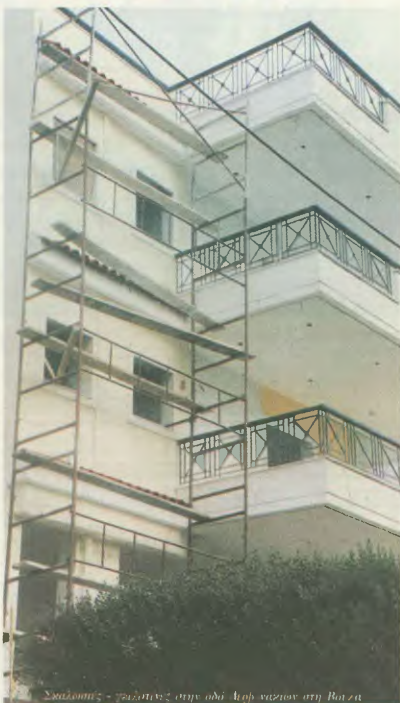
Ναυπηγός - τριάντες, στην οδό Αιολικών στην Βαλζα