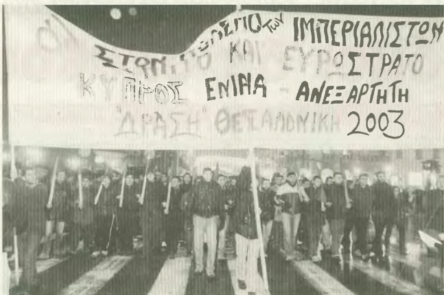
ΤΟ ΚΥΠΡΙΑΚΟ ΜΕΤΑ ΤΗΝ ΚΟΠΕΓΧΑΓΗ