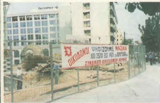
Πάνο σε εργοτάξιο στην Αλεξάνδρεια κατά την προεκλογική περίοδο