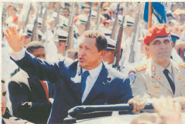
Ο Πρόεδρος Τσάβες χαιρετά υποστηρικτές του

Εννοείται, ότι η αντιπολίτευση δεν κατατέθηκε σκόνη τα όπλα. Ο εκπρόσωπος της αντιπολίτευσης, Τζέιμς Σαμπρίνο, δήλωσε στη διάρκεια συνέντευξης Τύπου πως η οργάνωση δεν πρόκειται να εγκαταλείψει τους χυλόμενους