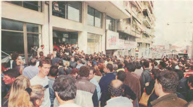
Στην αγορά για την «πρόοινη» κίετα

κή πολιτική. Με τους πόλεμους που αυτά κάνουν, με τα αντιδραστικά καθεστώτα και τα θεοκρατικά που αυτοί δημιουργούν και κατακυλεύουν με τη ληστρεία των πλουτοκρατικών πηγών των χωρών τους και των αποικιοκρατικών συμπεριφορών τους, τους αναγκάζουν να φύγουν μα θήση στον ήλιο.