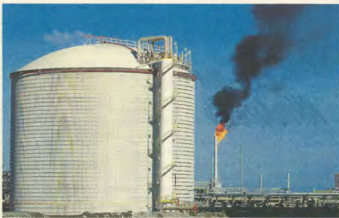
Τα πετρέλαια της Βενεζουέλας είναι αυτά που ενδιαφέρουν τους Αμερικανούς και όχι η «νίκη της δημοκρατίας»

Η Νέα Υόρκη όμως, ότι του Κάρκαρς, ήταν στο επίκεντρο των εξελίξεων που αφορούν στη Βενεζουέλα και όχι μόνο εξαιτίας της επίσκεψης Τσάβες. Στην ίδια πόλη βρέθηκε και η «τριανδρία» της αντιπολίτευσης της Βενεζουέλας, προκειμένου να ασκήσει πιέσεις, ενώ παρά την κρισιμότητα και του λόγου των Κουβανών του Μαίμι (πληροφο-