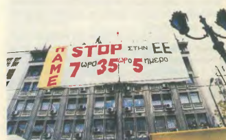
«Αν δεν ήμουν ισοπεδιστής θα ήμουν διαδηλωτής», δήλωσε ο Α. Ρέππας και οι εργαζόμενοι του φάρακα την κατάλληλη πελάτη