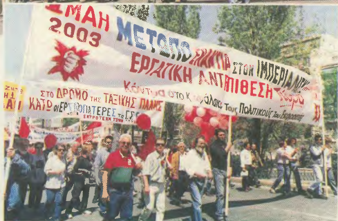
Τρία χαρακτηριστικά στιγμιότυπα από την πρωτομαγιάτικη συγκέντρωση και πορεία στην αμερικανική πρεσβεία