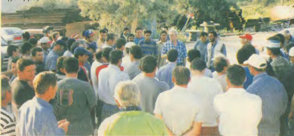
16 Μάη 2003: Στιγμιότυπο από την επίσημη εργασία στην «Ευρωπαϊκή Τεχνολογία της Ραφήνας»