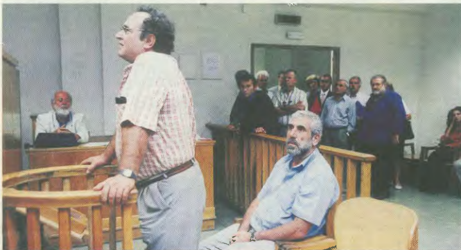
Ο γενικός γραμματέας της Ομοσπονδίας Οικοδόμων στο εδάλιο του κατηγορουμένου

Η εφημερίδα είναι υπεύθυνη όλων μας. Η διακίνηση της είναι χρέος μας. Είναι ο ΠΑΛΜΟΣ των ΟΙΚΟΔΟΜΩΝ.