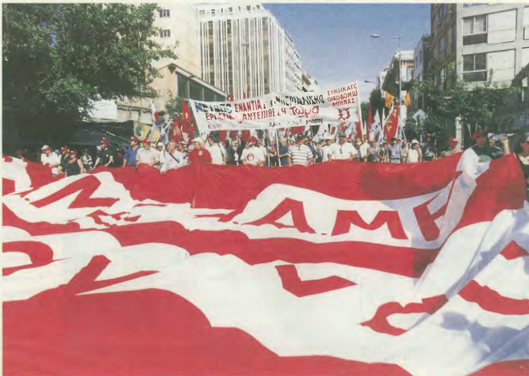
Από τις μεγαλειώδεις κινητοποιήσεις στη Σύνοδο Κορυφής στη Θεσσαλονίκη

Επέκταση της υπαλληλικής αποζημίωσης (Ν. 2112) για όλους.