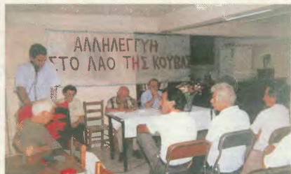
Λίνα χαρακτηριστικά στιγμιότυπα από την εκδήλωση του Παραρτήματος Γαλατσίου

σμό, τις δολιοφθορές, τις απάνεμες δολοφονίες, των ηγετών της επαναστατικής κυβερνήσεως και ειδικά κατά του Φιντέλ Κάστρο.