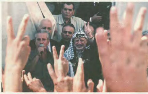
Ο Γιάσερ Αραφάτ χαιρετά τους συνημερωμένους Παλαιστίνιους, λίγο μετά την ανακοίνωση της απόφασης του Ισραήλ να τον απέλξει

Κάποια μίσησαν για "άσχημα ενέργεια" στην Παλαιστίνη, κάποια για "πολιτική τρέλα...". Η πραγματικότητα όμως, που επιμελεί να επιβλέπει ο ιμπεριαλισμός, αποδεικνύεται πως από που φαίνεται "άσχημα" είναι ιδιαίτερα... άσχημο και πολύ... λογικό, όταν εξημεριστεί τα ιμπεριαλιστικά σχέδια. Αποδεικνύεται με τον πιο χερκο-