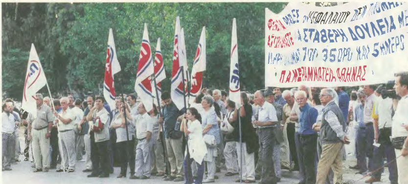
Από την κινητοποίηση στις 11 Σεπτέμβριο 2003 στον ΟΑΕΔ, στους Τράχωνες στο Καλαμάκι