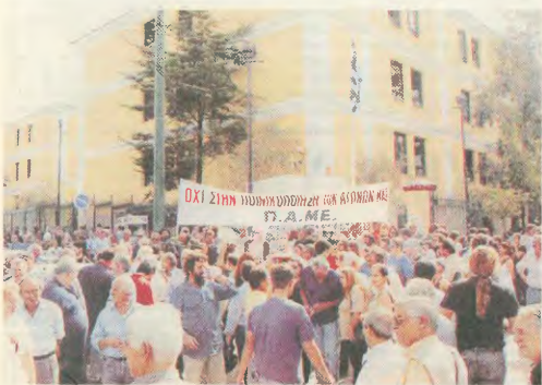
«Εξασφαλιζόντας» ποινή πέντε μηνών φυλάσεως με τριητή αναστολή σε βάρος επτά στελεχών του ΠΑΜΕ, με αρμονή την κατάληξη του δικαστηρίου Εργασιών, το 2001 (αριστερά δεξιά), η κυβέρνηση του ΠΑΣΟΚ επέλεξε να δώσει τα δικαιώματα των εργαζομένων να αγωνίζονται. Αντίηγη, ωστόσο, πήρε αμέσως από χιλιάδες εργαζόμενους, που συγκεντρώθηκαν έξω από τα δικαστήρια

Τη συμπαράσταση και αλληλεγγύη στους συνδικαλιστές « αγωνιστές του ΠΑΜΕ» εξέφρασε η διοίκηση της Ομοσπονδίας Υπόδη Χάρσιου και σημείωσε ότι η ποινική διατήρα που άσκησε η κυβέρνηση και η καταδίκη από την ανεξάρτητη δικαιοσύνη, στους αγωνιστές του εργατικού ταξικού συνδικαλιστικού κινήματος, έχει στόχο να τρομοκρατήσει, νενότασει τους εργαζόμε-