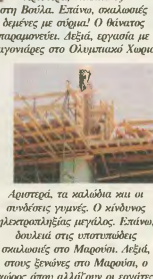
Ατυχήματα, τα καλώδια που οι συνάδελφοι γενιές. Ο κίνδυνος ηλεκτροπληξίας μεγάλος. Επίσης, δουλειά στις υποκατασκευές σωλωτές στο Μαρούσι. Αλλά, στον έρωτα των αλλώνων οι γέφυρες