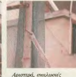
Ατυχήματα, σωλωτές στη Βούλα. Επίσης, σωλωτές άρνες με σφάλμα! Ο θάνατος προεβλεπόταν. Δείξη εργασιών με αγονιές στο Ολυμπιακό Χωρό