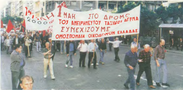
1η ΜΑΗ 2004