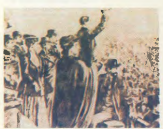
Εργατική κινητοποίηση στην Αμερική του 19ου αιώνα

καθηκτικές διαστάσεις. Γράφοι ο Μαρξ σχετικά: «Στις Ενωμένους Πολιτείες της βόρειας Αμερικής παράλληλα κοβό αυτοτελείς εργατικό κίνημα, όσον κοβό η δουλειά παραμόρφωση ένα μέρος της δημοκρατίας. Η εργασία του οχτώωρου με λεική επιβεβαίωση δεν μπορεί να χαρακτηριστεί εκεί όπου σηματοποιεί η εργασία των ανθρώπων με μεγάλη επιδεξιότητα. Από το θάνατο της δουλειάς όμως, ξεπήδησε αμέσως μια καινούρια φρονιμομένη ζητ. Ο πρώτος καρπός του εμφύλιου πολέμου ήταν η ζύμωση για το οχτώωρο, που με ταχύτητα ατυμομηχανής προχωρή από τον Ατλαντικό έως τον Ειρηνικό Ωκεανό, από τη Νέα Αγγλία έως την Καλιφόρνια.