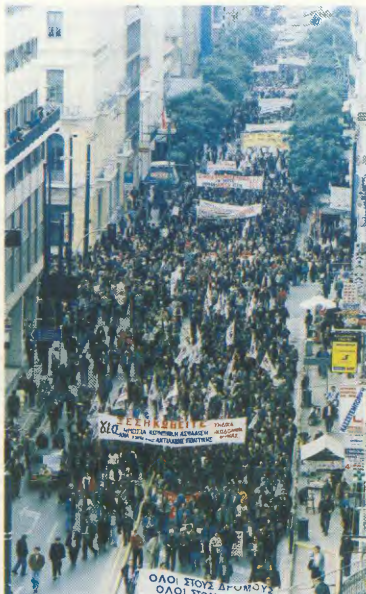
Η Κοινωνική Ασφάλιση γίνεται πάλι στόχος του κερατάου