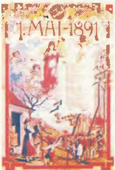
Ανταξιακή αψίδα για την 1η Μάη 1891

Νοβέμβριος 1887: Οι συνδικαλιστές Σπιάς, Φίσερ, Πίτσον, Εγκελ οδηγούνται στο θάνατο