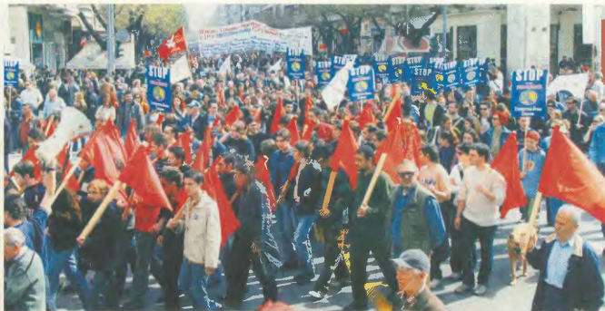
Από το αντιπολεμικό συλλαλητήριο στις 20 Μάρτη στην Αθήνα

Τώρα, που ο Τάσος Παπαδόπουλος, ο Πρόεδρος της Κύπρου, κάλεσε τον κυπριακό λαό να πα... το «βροντικό ΟΧΙ», γιατί ο πρόεδρος του ΠΑΣΟΚ δεν κάνει ένα βήμα για ένα συμμετοχικό δημοψήφισμα, να τοποθετηθούν τα 1.018.000 μέλη. Το ερώτημα θέλει απάντηση. Και οι έχοντες δικαίωμα ψήφου απ' αυτούς που συμμετείχαν πρέπει να πάρουν θέση. Εμείς το σχολιάζουμε καθορί τότε (με τη «συμμετοχική» ντε) έπαιρναν απάντηση τα FAX, όπως και το δικό μας, του Σύνδικατος κι έστειλαν οδηγίες, που, πώς και πότε υπήρξαν. Και το FAX όπως είχαμε γράψει στο προηγούμενο φύλλο, είχε σταλεί από την Υπηρεμαρχία Αθηνών! «Θεοί και δαίμονες» τότε για τη «συμμετοχική δημοκρατία... Τώρα τι είναι...;