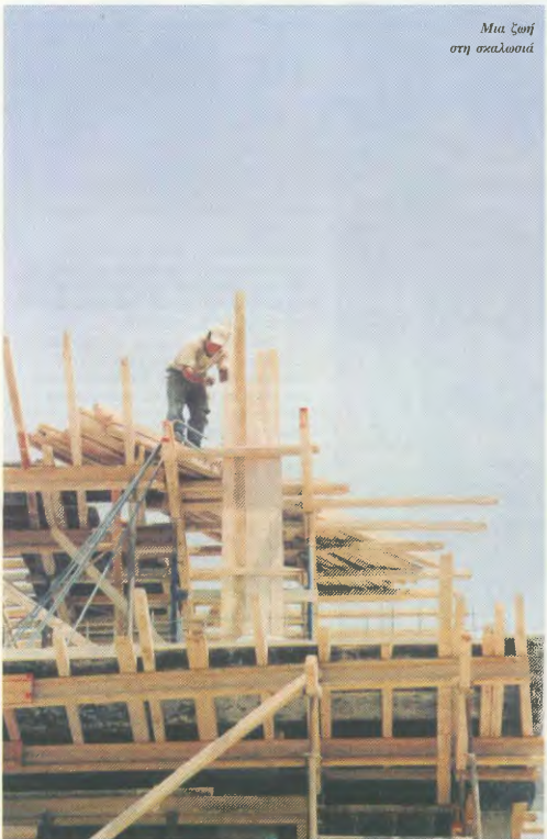
Μια ζοφή στη σκαλωσιά

Τ ώρα, που ο προεκλογικός καιροσχημάς των συνταξάντων του δικαιοδοτήριου από την ακοταχτητή παραχρηστική κατάσταση.