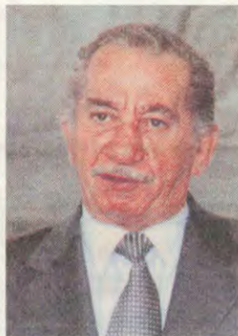
Ο Πρόεδρος της Κυπριακής Δημοκρατίας και αριστερά στιγμιότυπο από την υλοποίησή του μετά το διάγγελμα προς τον κυπριακό λαό

ΤΑΣΣΟΣ ΠΑΠΑΔΟΠΟΥΛΟΣ: «ΟΧΙ» στο σχέδιο Ανάν Υπερασπιστείτε το δίκαιο, την αξιοπρέπεια και την ιστορία σας