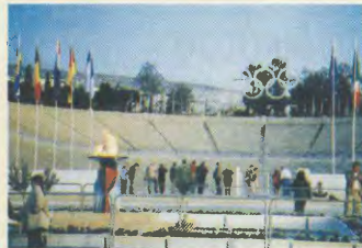
Αριστερά: Η Ολυμπιακή φλόγη στην είσοδο του Καλλιμάρμαρου. Δεξιά: «Η γιορτή μας πλησιάζει» - «Coca Cola» Φότσο, το Κέντρο Γραμματοτύπου στο Μυρτοίσι

Σήμερα, συνισμάει και το γενικότερο πλαίσιο αμφοτεροκαταστάσεων του αθλητισμού