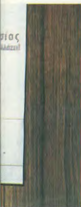
...α οι στρατοκράτες,

ΝΑΤΟικά πολεμικά πλοία, με τη συνδρομή πλοίων του βου στόλου των Αμερικανών, θα περιπολούν εκτός και αν παραστεί ανάγκη και εντός των ελληνικών χωρικών υδάτων.