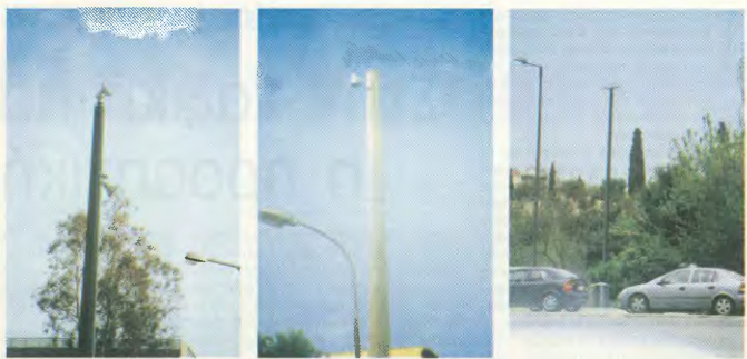
Οι κάμερες στη ζωή μας... Από αριστερά, στην οδό Ούλοφ Πάλμε στην Πανεπιστημιούπολη, στην οδό Καλλιθέας, στην Αγ. Παντελεήμονα και στη λεωφόρο Βουλιαγμένης

Ταξικό μας χρέος, να μην τους το επιτρέψουμε.