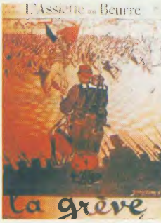
Γαλλική αψίδα για την Πρωτομαγιά