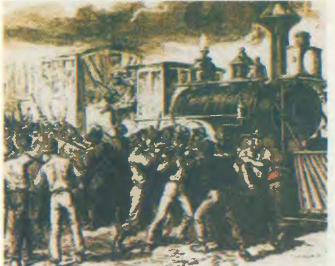
Σικάγο: Το εργατικό κίνημα θηρηγεί τα πρώτα θύματα