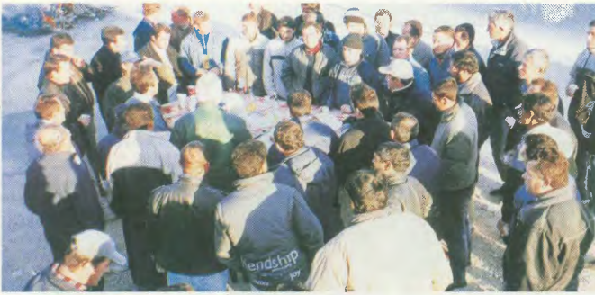
Οι ακτήρονοι εργάτες της «Ευρωπαϊκής Τεχνικής», στην κεντρική είσοδο του εργοταξίου, πραγματοποιούν επίδειξη εργασίας και κόβουν την πίτα για το 2004