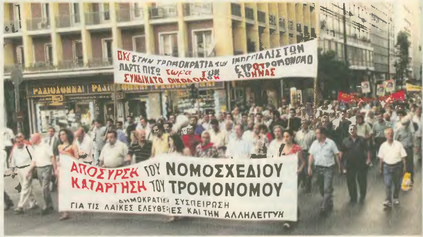
Από την κινητοποίηση για τον «τρομονόμο Νο 2», στις 22 Ιουλίου

Σε καθημερινή πλέον βάση, όλο και πιο ξεκάθαρα εμφανιζόμεις πως είναι άξιος πολιτικός εκπροσώπος των καπιταλιστών. Και για τον λόγο του αληθές: Για μέρες μετά τις ευρωεκλογές - αφού μέχρι τότε ήθελε να εμφανιζει «φιλολογικό» προσώπειο, για την υπαράσπιση της ψήφου - καθάβεις νομοσχέδιο - έκτρωμα, το οποίο και ψήφισαν, τον «προνομώ» Νο 2. Θεωρείς το ευρωένταλμα σύλληψης και παράδοσης, φιλικάδεις στην ουσία δημοκρατικά δικαιώματα και λαϊκές ελευθερίες. Αναθέεις την ασφάλεια των Ολυμπιακών Αγώνων στο ΝΑΤΟ και τους Αμερικανούς, καθιστώντας τη χώρα έφραγο αμείλι στους προτάτες συμμάχους μας, οι οποίοι, στον το μεγάλο αδελφό, δε παρακολούθουν απ' υψηλό στρατηγιστήριού, ό,τι ακουει, βλέπεις η ανχεινόμενοι ο χίτες και πλέον κάμερες που στήθηκαν σε κάθε διασταύρωση του Λεκανοπέδιου. Αυτές, λοιπόν, οι κάμερες, που έχουν δημιουργήσει «κλόδο» σε ολόκληρο το Λεκανοπέδιο, ένα μέχρι προχές ήταν για την ασφάλεια των Ολυμπιακών Αγώνων, έφραγο το υπουράγος Δημόσιος Τόξης και