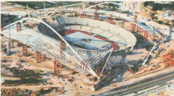
Το στέγαστρο Καλατζίφρα (πάνω) έχασε τελικά το «χρυσό» μέταλλο των υπερβίσιων από το Στάδιο Ειρήνης και Φιλίας (κάτω)

Αλήθεια, τελικά πού είναι τα οφέλη για τους εργαζόμενους - όποιους ελάχιστους α χρεώσαν οι σημερινές κυβερνήσεις - από τη διοργάνωση; Τότε, που άλλοι προπαγανδίζουν οικονομική ευμάρεια, αναπτύξη, καταπολέμηση της ανεργίας. Τώρα, οι ίδιοι μοιολογούν την αύξηση της ανεργίας μετά το τέλος των Αγώνων και ψιγώνουν να βρουν λύσεις διαχείρισης του προβλήματος. Λύσεις, βέβαια, που βασίζονται στην πεναμπύνη, όπως τα φορολογικά και άλλα κίνητρα που ζητούν οι μεγαλοεργολάβοι, τα οποία τα πληρώσει πάλι ο λαός, στο όνομα