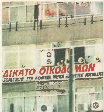
Αυτή η ταμπέλα ενόχλησε

Σε ανακοίνωση - καταγγέλλεις προχώρησαν μέχρι στιγμής εκτός του Συνδικάτου μας και η Ομοσπονδία Οικοδόμων οι: