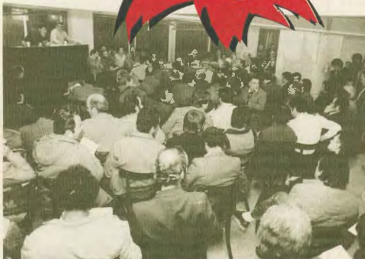
Στιγμιότυπο από την ιδρυτική Γενική Συνέλευση του Συνδικάτου μας, το 1984

Συνεχίζουμε πιο δυνατά πιο μαζικά τους αγώνες Ενάντια στο κεφάλαιο και τον ιμπεριαλισμό