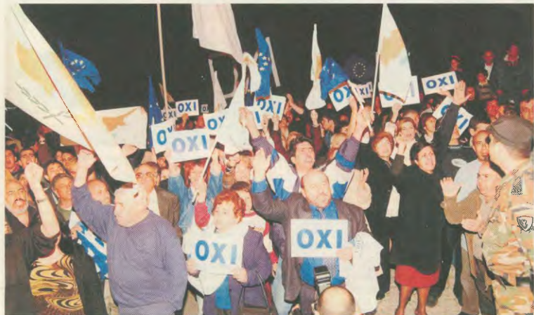
ΤΟ «ΟΧΙ» ΤΩΝ ΚΥΠΡΙΩΝ