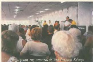
Εμπειρία της αστοχίας στο Ιατρικό Κέντρο