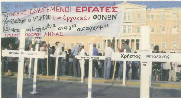
Στιγμιότυπο από την εκδήλωση του ΠΑΜΕ στο Σύνταγμα

γραφε και το αντίστοιχο όνομα του νεκρού συναδέλφου.