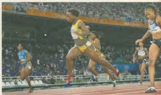
Στιγμιότυπο από τους Αγώνες της Αθήνας. Η εκμεταλλοποίηση του αθλητισμού έκανε πια ρακετών αθλητών σε βρώμικες μεθόδους

Με τη λέξη ντόπιος, μετά από όσα είδα, άκουσα, «μέληψα», κατάλαβα πως πρόκειται για χορηγία κάποιου αμεινωμένου στόχου αθλητή, οι οποίες βοήθουν να υπερβάλουν εαυτών και να πετύχουν μεγάλες επιδόσεις, ρεκόρ. Να καταφέρνουν γρηγορότερα, ψηλότερα, εντυπωσιακότερα πράγματα, τα οποία, φυσικά, θα τους αποφέρουν και χρήματα. Και ο σ' αυτήν την Ολυμπιάδα είχαμε αρκετά τέτοια παραδείγματα χρήσης αναβολικών, που είτε αποδείχτηκαν, είτε υπήρξαν σκέτες και απορίες. Χαρακτηριστικά, στο 100