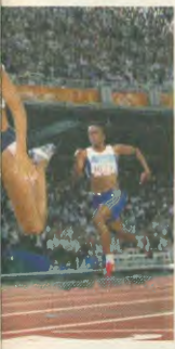
πο ασηνήτη την καρκατεία

πλούτισαν με τις πρώτες που καταφεραν σε διάφορα αγωνίσματα: Αυτή είναι η λογική του δικού τους κόσμου. Είναι η λογική του καπιταλισμού. Είναι το πλαίσιο ανάπτυξης του αθλητισμού, που επιβάλλουν οι χορηγοί και οι υπάλληλοί τους, οι «αθάνατοι» της ΔΟΕ. Όσοι υποστηρίζονται αυτό, θέλουν να συγκλιψουν τον στραβά και ανάποδο του ίδιου του καπιταλιστικού συστήματος. Γι'αυτή και με το ζήτημα του υπότιπικ συγκροτήσαν δύο μοντέλα: Το ένα, που λέει ρεκόρ με κάθε τρόπο, με σκοπό το κέρδος και το άλλο, που δημιουργεί προϋποθέσεις με τη συμμετοχή των εργαζόμενων και του λαού στον αθλητισμό, να προκύψουν άνθρωποι - αθλητές, που λειτουργούν ως θετικά πρόσωτα στην κοινωνία και είναι αποτέλεσμα της ανάπτυξης της κοινωνίας με βάση τις ανθρώπινες ανάγκες. Αθλητές που με τη συνολική τους προσφορά στην κοινωνία και τον αθλητισμό, θα είναι σε θέση να υποστηρίξουν το «αργαίο πνεύμα αθάνατο», αλλά και να συμβαδίζουν με το ριγτό των αρχαίων Ελλήνων: «Νους υγιής εν σώματι υγιεί».