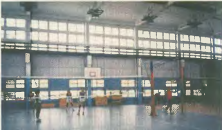
Κλασικό γήπεδο βάσκετ στο αθλητικό γυμνάσιο

Η αντιπροσωπεία του ΠΑΜΕ ενημερώθηκε εξειστικά από τον υπευθύνου εδαφικών και από κυβερνητικά και κομματικά στελέχη για τα προβλήματα, τις ανάγκες, αλλά και τα μεγάλα επιτεύγματα του κουβανικού λαού. Ο ρόλος του Κομμουνιστικού Κόμματος Κούβας είναι καθοριστικός για το μέλλον της χώρας. Το Κόμμα καθορίζει τον κουβανικό λαό, ο οποίος βλέπει τα επιτεύγματα της σοσιαλιστικής επανάστασης και μπορεί να αντιστέκεται στην προπαγάνδα των Αμερικανικών και Ευρωπαϊκών ιμπεριαλιστών. Η λαϊκή εξουσία στην Κούβα παραμένει μαχητικά δημοκρατική σε όλα τα καταπιναστικά κράτη. Το εκλογικό σύστημα στηρίζεται στην άμεση δημοκρατική συμμετοχή όλου του λαού,