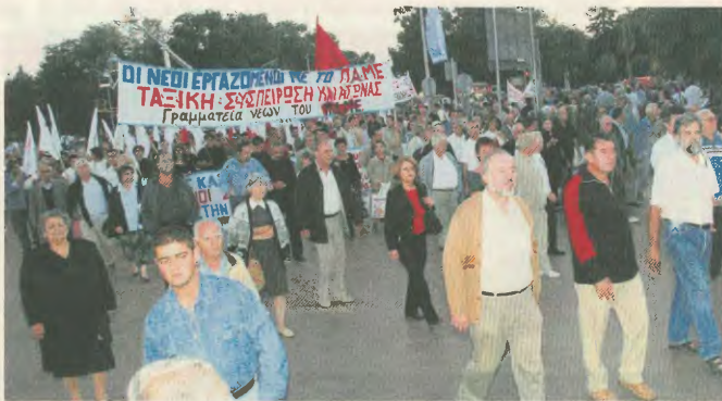
Ένα στιγμιότυπο από τις κινητοποιήσεις του ΠΑΜΕ στη Θεσσαλονίκη, τη μέρα της ομιλίας του Κ. Καραμηνλή στη ΔΕΦ

Τώρα, είναι η κυβερνηση Καραμηνλή που ογκήνε το σύνθημα της «ανάπτυξης» και της «συνυχής». Πλου από τον υπερπτό, το ΠΑΣΟΚ με τους «κοινωνικοα εταίροα» στηρίζε και απαιτεί πιο γρηγορο ρυθμοα στο δρόμο της Λιαβαθίνης. Όλοι τους, από τον Αλγοσκουφίτη, τον Παπανδρέου, τον Κυριακόπουλο μέχρι τον Παλιζωγούπολο, δειχώνε το μονόδρομο της ανταγωνιστικότητας και της