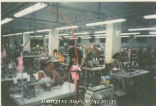
Παιχνίδια αυτοεργασίας για το

στην ανάδειξη των εκπροσώπων του από το επίπεδο γειτονίας μέχρι αυτό της εθνικοσύνθεσης. Ο υποσημείο υποπεκτικότητας και προκρίνουν από το λαό, με την ενεργό συμμετοχή των εργατικών συνδικάτων σε κάθε φάση της εκλογικής διαδικασίας. Όλοι οι εκλεγμένοι στα όργανα, είναι ανακλητοί και υποχρεωμένοι να λογοδοτούν για τις πράξεις τους, στο λαό που τους εξέλεξε. Η συμμετοχή στις εκλογές ανηίζει το 98%, χωρίς οι εκλογές να είναι υποχρεωτικές.