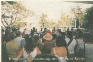
Εμπειρία της αστοχίας στο Αθλητικό Κέντρο