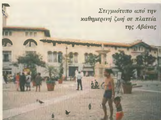
Σχολείο υπό την καθημερινή ζωή σε πλατεία της Αθήνας

Η ανωνυμία για την έκδοση συντάξεων από το ΙΚΑ κωμικείται από 4 έως 15 μήνες και οι προηγουμένως διοικητικοί, ιατρικοί και νοσηλευτικοί προσωπικοί που σχεδονίζονται επίσης πολύ από τις τεράστιες απειλές του ιδιωτισμού.