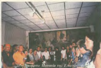
Εμπειρία του Μουσείου της Επιστήμης