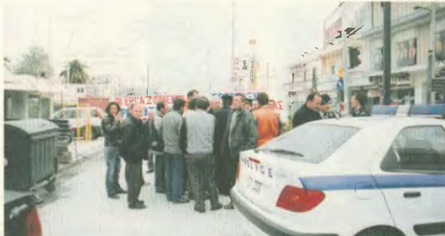
Ότι και η Αιτωνμία, που κλήθηκε, λόγω των αποφασιστικών των εργατών στο εργατικό του ΜΕΤΡΟ στο Αργάλεο