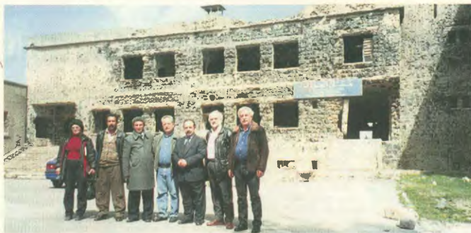
Η αντιπροσωπεία του ΠΑΜΕ με φόντο το βωφραδισμένο νοσοκομείο της πόλης Κουβίντρα, δείγμα της φασιστικής ηθικωδίας των Ισραηλιτών στην περιοχή του Γκολάν (1973). Τρίτος από δεξιά ο Γραμματέας των Λεβάνων Σχίστας της Συναγής Γενικής Συνομοσπονδίας, συν/λφος Αχμέτ, με τον πρόεδρο του Συνδικάτου.