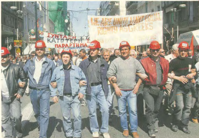
Μαζί με τους Έλληνες εργάτες και οι μετανάστες και πολιτικοί προηγούμενες

1 Sinif Bilincimiz Mayıs Karalığımız ve 2008 Cüretimizle