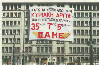
Το υπουργείο Ανάπτυξης «εξοπλισμένο» με το παλιό του ΠΑΜΕ

Σήμερα που η τεχνολογία είναι τέτοια που θα επέτρεπε σημαντικά και γενικευμένα μέρητα ανακούφισης των εργαζόμενων η κυβέρνηση, στο χάρη της προηγουμένης ε-