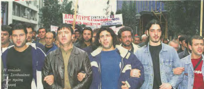
Η ομάδα του Συνδικάτου στη πορεία χιμωτή

ΤΡΑΞΙΚΟΣ ΠΑΝΕΡΓΑΤΙΚΟΣ ΣΥΝΑΓΕΡΜΟΣ ΕΝΑΝΤΙΑ ΣΤΑ ΜΟΝΟΠΩΛΙΑ ΚΑΙ ΙΜΠΕΡΙΑΛΙΣΜΟ ΣΥΝΔΙΚΑΤΟ ΟΙΚΟΔΟΜΩΝ ΑΘΗΝΑΣ