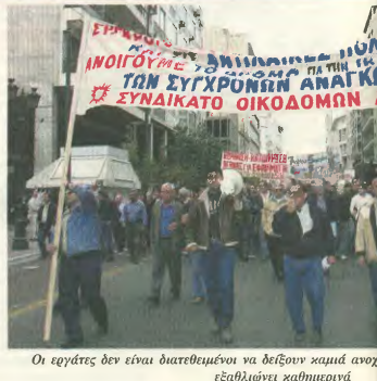
Οι εργάτες δεν είναι διατεθειμένοι να δείχνουν καμιά ανοχή εξελίξεων καθημερινή

• Την υποτέλιση αυστηρότερων κτηρήτων για την παροχή του πενήχου επιδόματος ανεργίας, προκειμένου να εξαναγκάσει ο άνεργος να δεχτεί την όσα δουλειά του προτείνουν