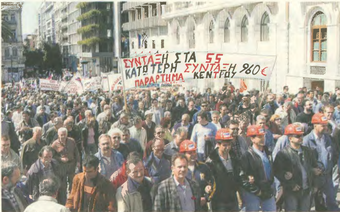
Από την τελευταία απεργιακή κινητοποίηση

Το Πανεργιακό Αγωνιστικό Μέτωπο είναι ο εκφραστής μας τέτοιας απεργιακής. Η αναμείβεται πορεία που στη γραμμή της πάλης και της ταξικής συγκρούσεως, η υποστήριξη στις γραμμές νέων δυναμένων μας γεμίζει με αισιοδοξία για το αύριο. Στις 17 Μάρτη χιλιάδες εργάτες σε όλη τη χώρα εξέφρασαν, κάτω από τα πανό του ΠΑΜΕ και των ταξικών συνδικάτων, την ταξική