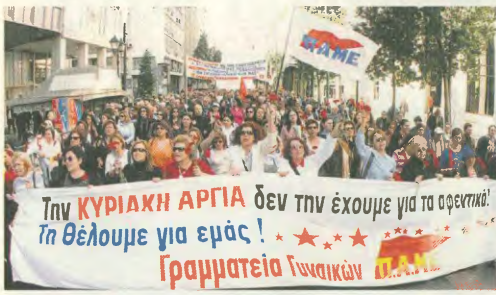
Από την κυριαρχική κινητοποίηση στις 17 Απριλίου

Το λεγόμενο κόστος εργασίας από 1 μονάδα προϊόντος στην Ελλάδα την περίοδο 1981-2000, εμφάνιζε κατά μέσο όρο ετήσια μείωση 0,4%, ενώ την περίοδο 2001 - 2004 υποχώρησε κατά 0,6%. Τα στοιχεία αυτά, τα οποία περιέχονται στην τελευταία έκθεση των εαρινών προβλέψεων της ΕΕ, από μόνον τους αποτελούν τηχηρό ρόπαλο, σε όλους εκείνους (κυβερνήσεις ΠΑΣΟΚ και ΝΔ, Μέσα Ενημέρωσης, συνδικαλιστές ηγεσίες, Τράπεζα Ελλάδας), που προσπαθούν να πείσουν την κοινή γνώμη ότι η μειωμένη ανταγωνιστικότητα της ελληνικής οικονομίας - κεφαλαιού και ο υψηλός πληθωρισμός οφείλονται στους υψηλούς μισθούς... Αντίθετα, σύμφωνα με την ΕΕ -όχι ότι η τελευταία αυτή έρευνα δείχνει τους εργαζόμενους, αλλά σαν γενικό ποσοτήτητα των συμφερόντων του ευρωπαϊκού κεφαλαιού, δεν έχει κανένα λόγο να μπει σε παιγνίδια μικροπολιτικής σταθερά τα τελευταία 24 χρόνια (1981-2004) ο μέσος ρυθμός αύξησης των μισθών, υπολείπεται του ρυθμού αύξησης της παραγωγικότητας της εργασίας, γεγονός που σημαίνει ότι οι εργατοκατασκευαστές εκμεταλλεύονται