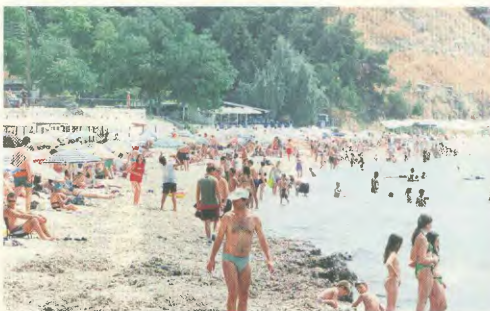
Με 330 ευρώ από το ταμείο ανεργίας, τις παύσεις τις βλέπουμε μόνο από φωτογραφίες

Βλέπεις για τους εργαζόμενους και τους άνεργους, οι ανάγκες και τα προβλήματα δεν κάνουν διακοπές. Ίσα - ίσα που παραμένουν, μεγαλύτεροι, φρονισμένοι, πολυαπαιτούμενοι, διοργανώνονται στην κάθε λαϊκή οικογένεια συνεχώς