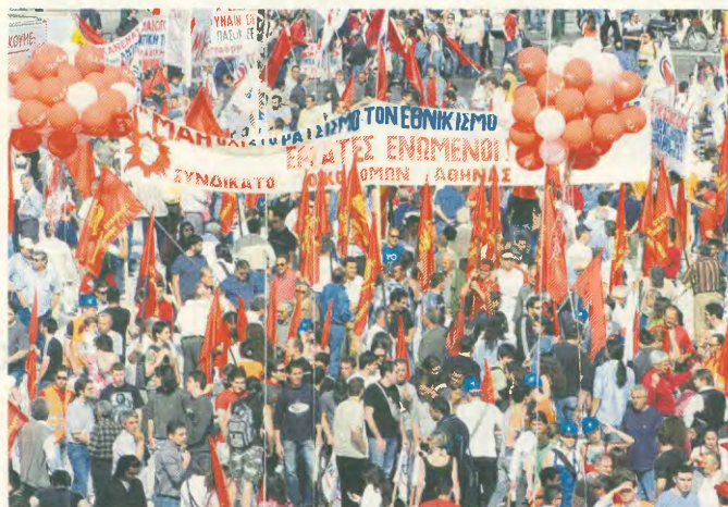
Το πανό του Συνδικάτου στην απεργιακή συγκέντρωση της Πρωτομαγιάς

Δινομή τη μάχη με όλες μας τις δυνάμεις για την επιτυχία της 24ωρης απεργίας.