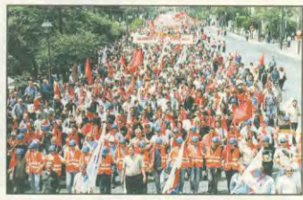
Η Βασίλισσα Σοφία «κόκκινο ποτάμι» προς την αμερικανική απεργία

άλλες μάχες μπορούν να κερδηθούν κι ο δικός μας κλάδος έχει να δώσει μια ακόμα άμεση μάχη, αυτή στις 29 του Ιούνη. Τη μάχη της πανελλαδικής απεργίας. Μια μάχη που δίνουμε, για να απαντήσουμε αποφασιστικά στην κυβερνητική, αντιλαϊκή πολιτική, για να υπερασπιστούμε τα δικαιώματά μας, για να επιβάλουμε το δικό μας δικαίωμα. Και αυτήν τη μάχη πρέπει να την κερδίσουμε. Και θα την κερδίσουμε αν γίνει υπόθεση του καθενός μας. ΣΕΥΝΑΓΕΡΜΟΣ, λοιπόν, στις δυνατότητες μας.