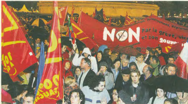
Πασηγηφισμοί από υλοσηφιστές του ΟΧΙ στη Γαλλία, μετά την ανακοίνωση του αποτελέσματος

ση, έγκαιρα είχε τοποθετηθεί απέναντι στο «Ευρωσύνταγμα» και επισήμως, με εκδηλώσεις, επιστομικές ημερίδες και διαδηλώσεις, τους κινδύνους που εγκυμονεί για τις δημοκρατικές κατκτηρήσεις, τα δικαιώματα και τις ελευθερίες των λαών της Ευρωπαϊκής Ένωσης. Το λεγόμενο «Ευρωσύνταγμα» επιτείνει τους περιορισμούς