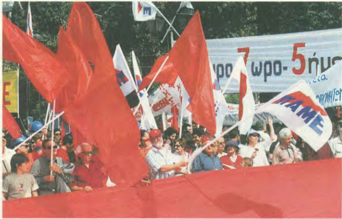
Το αίτημα για 35ωρο, 7ωρο, 5νθήμερο και τα λάβαρα του ΠΑΜΕ, του ταξικού πόλου στο συνδικαλιστικό κίνημα

Αν, για παράδειγμα, ένας εργοδότης ζητήσει από τον εργαζόμενο να παραμείνει στη δουλειά για 12 ώρες, τις 4 από τις οποίες δε θα παράγει άμεσα έργο, αλλά θα περιμένει μήπως