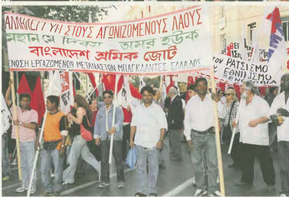
Στην απεργιακή συγκέντρωση στο Σύνταγμα και στην πορεία συνάδελφοι μετανάστες και πολιτικοί πρόσφυγες

πρόβλημα της υπερεκμετάλλευσης της εργατικής δύναμης των μεταναστών, αφού η παράνομη παρουσία τους ευνοεί τους εργοδότες, που αξιοποιούν τη μισθία εργασία, δηλαδή την πλήρωση των μεταναστών έξω από τις συλλογικές συμβάσεις και χωρίς έντομα. • Οι διακηρύξεις περί ισότητας ημεσάτων και μεταναστών παρόμοιων χωρίς αντικρισμό. • Όχι μόνο δεν επιλύει τα προβλήματα αλλά η παραμονή τους εξαρτάται άμεσα από τις εκάστοτε κυβερνήσεις και τις πολιτικές τους. • Στη θέσπιση των διαφόρων Επιτροπών βασικά συμμετέ-