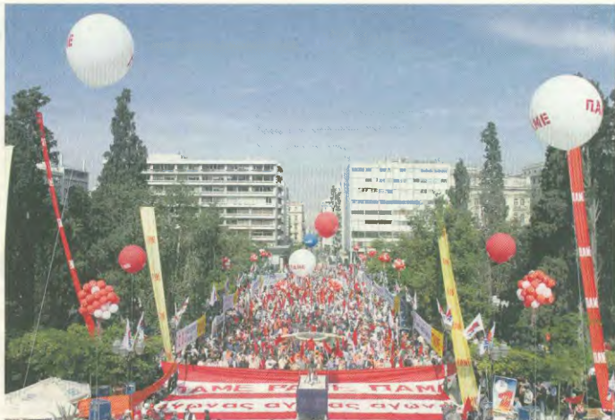
Το Σύνταγμα φέρσει τα καλά του για την Πρωτομαγιά. Φοιτήτες γι' αυτό το ΠΑΜΕ

Δεν υπαρκεί πλέον καμία αμφιβολία ότι το ΠΑΣΟΚ και από τη θέση της αντιπολίτευσης βαράει τον ίδιο χυάβι που είχε όταν ήταν και στην κυβέρνηση. Κασιές «ψηλές» νοτες που πετάει, σε πισοτα δεν αλλάζουν τη δικαιοματή και «συμφωνία». Το ΠΑΣΟΚ αποδεικνύεται επικίνδυνο για τα λαϊκά συμφέροντα όπως ακριβώς και η ΝΔ και από τη θέση της αξιωματικής αντιπολίτευσης. Αναδεικνύεται περριπανά από τη ηγεσία του ΠΑΣΟΚ όπως και η ηγεσία της ΝΔ είναι στρατευμένες «ψηχ τε και σε ωματι» στην υπηρεσία της πλουτοκρατίας. Ως τέτοιοι και οι δύο πρέπει να αντιμετωπιστούν από τους εργαζόμενους ακομά και από τους απώλους οπαδούς και ψηφοφόρους τους