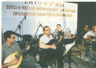
Από στιγμιότυπα από την εκδήλωση των Συνδικάτων για τα 60 χρόνια της Αντιφασιστικής Νίκης. Επάνω, άσπρη των συγκεντρωμένων και κάτω η ορχήστρα που έπαιξε εργατικά - αντιφασιστικά τραγούδια