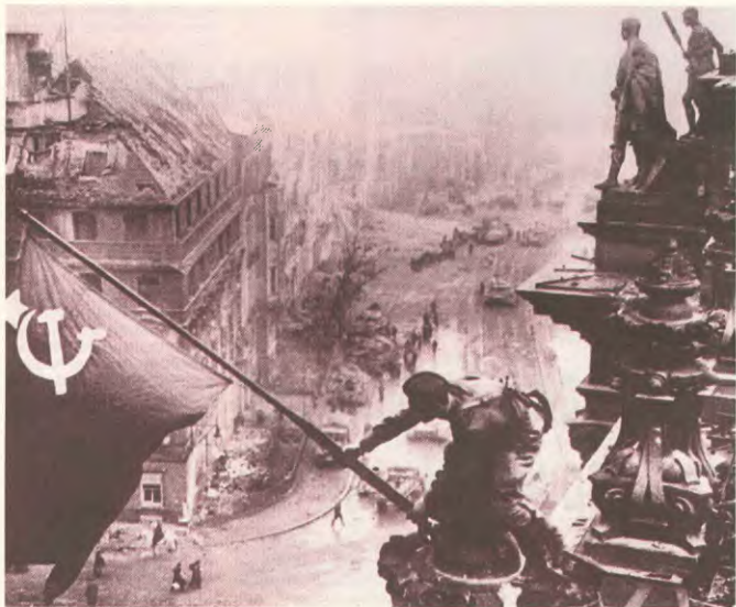
Η ορεινή ομάδα ανειδίκευτοι στο Ράιχσταγκ