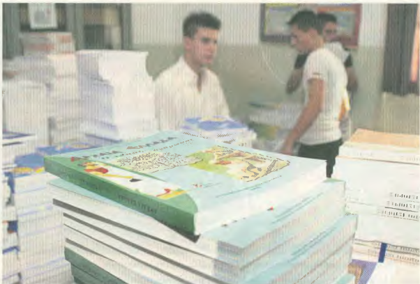
Τα βιβλία πρέπει να είναι εργαλεία μάθησης και όχι μέσο καταπίεσης των μαθητών

γευμα πρέπει να πάνε στο φροντιστήριο των ξένων γλωσσών, αφού στο σχολείο οι ξένες γλώσσες διδάσκονται έτσι, χωρίς πρόγραμμα, αλλά και στον ελεύθερο χρόνο της γειτονιάς, αφού στο σχολείο η Φυσική Αγωγή είναι μάθημα... καθιστικό!