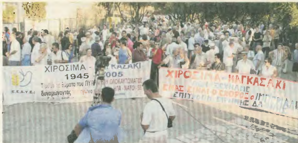
Το φιλεργιακό κίνημα πραγματοποιεί εκδήλωση στον βράχο της Αχρόπολης στις 8 Αυγούστου, για την 60ή επέτειο της ερήνης της ατομικής βόμβας σε Χιροσίμα και Ναγκασάκι