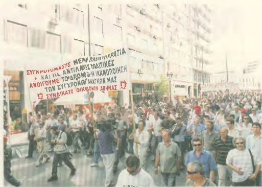
24 Ιούνης 2005: Η κεφαλή της πορείας στο υπουργείο Εργασίας