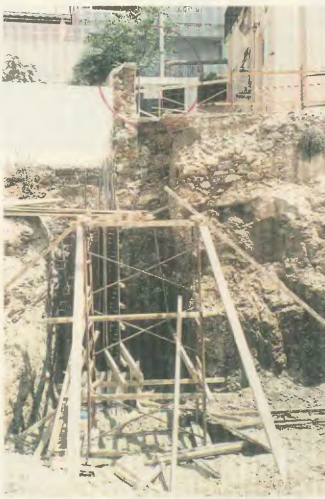
1 Ιουλίου 2005: Εδώ άφησε την τελευταία του πνοή ο 62χρονος Τζιτζής Ευάγγελος. Με κόκκιλο σημειώνεται το σημείο από όπου «έπεσε».

- Στις 2/06/2005 παραλύει τα «χειρότερα» για τον συνά-