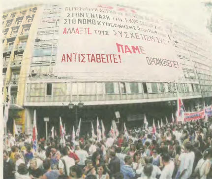
19 Ιούλης 2005: Από την κατάληψη στο υπουργείο Εργασίας (Σταδίου)

Ανωτάτα, βροντερά συνθήματα πήγαν στο κέντρο της