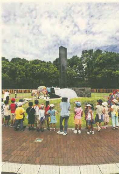
Γιαπωνέζοι μαθητές επισκέπτονται το μνημείο που έχει υψωθεί στην πόλη Ναγκασάκι, για να θυμίζει τα θύματα της ατομικής βόμβας

Αυτή όμως η σύγχρονη βαρβαρότητα έχει εξησκώσει τους λαούς σε πολλές γωνιές του πλανήτη. Το παγκόσμιο αντιιμπεριαλικό κίνημα δυναμώνει, συνειδητοποιεί τους νέους κινδύνους και βαθύνει τα ουνοαρσένια του χαρακτραριστικά. Οι φιλεργιαστές κινούνται και το εκφράζουν με τους στόχους πύλης τους: ότι μόνο με την αναστροφή του ιμπεριαλιστικού συστήματος μπορεί να υπάρξει και να εδραιωθεί η διαρκής ειρήνη.