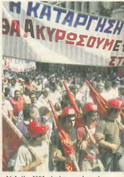
26 Ιούλης 2005: Από την τελευταία κινητοποίηση των εργαζομένων