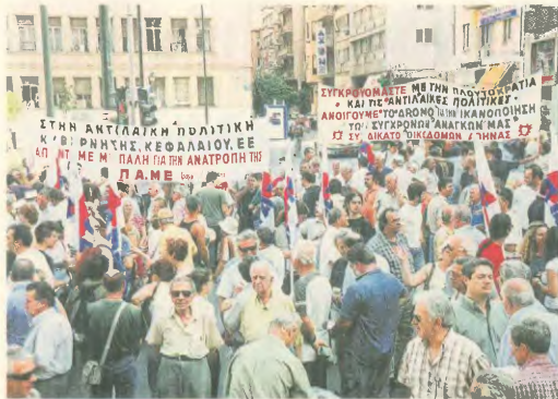
24 Ιούνης 2005: Αποψη από την πλατεία Κάνιγγος