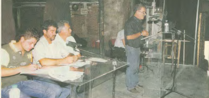
Ο πρόεδρος του Συνδικάτου στο βήμα και το προεδρείο της συνέλευσης.

νάγκες, οδηγούνται στη μονιμοποίηση της υπερωριακής απασχόλησης, στη δουλειά τα Σαββατοκύριακα, σε υποχρηστές μπροστά στην εργοδοτική αυθαίρεση, όπως μειωμένα μέτρα ασφαλείας, απλήρωτα υπερωρία, ανασφάλιση δουλειά.