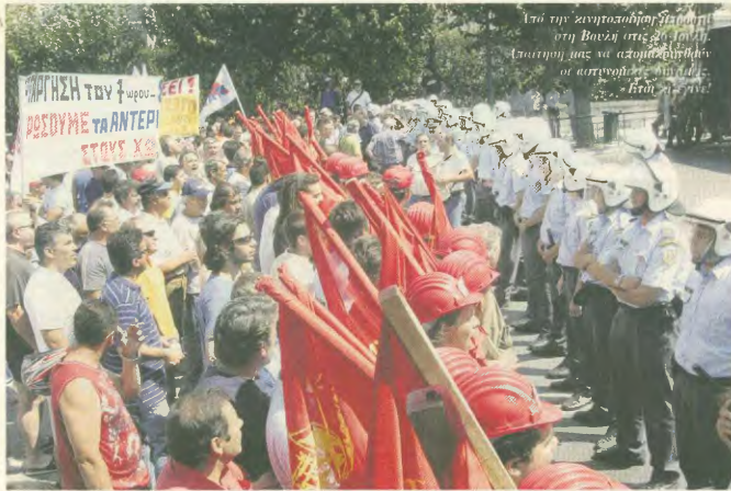
Από την κινητοποίηση των εργαζομένων στη Βουλή στις 25 Ιουνίου. Στήριξη μας να απομακρυνθούν οι αντιπροσώποι από τη Βουλή.

γατικές στρατηγικές επιδιώξεις του κεφαλαίου (της ανταγωνιστικότητας, της παραγωγικότητας, της κοινωνικής συνείδησης), με το ίδιο το κεφάλαιο.