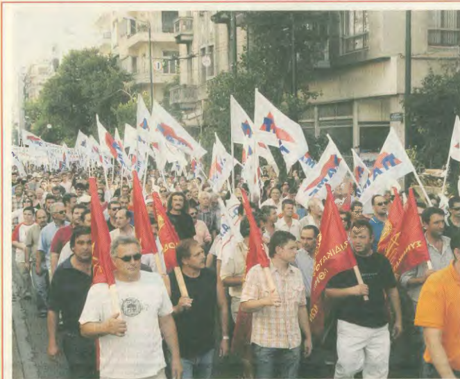
Με τα λάβαρα του Συνδικάτου και του ΠΑΜΕ στην πορεία προς το υπουργείο Εργασίας και στη συνέχεια στη ΓΣΕΕ, για τον στήσιμο κοινωνικού διάλογου κυβέρνησης - ΣΕΒ - εργατοπατέρων

Τα αναπροσαρμοστικά μέτρα των κυβερνήσεων ΠΑΣΟΚ και ΝΔ έ- χουν δώσει ισχυρό κίνημα στα ασφαλιστικά δικαιώματα. Τα συ- μβατικά σχέδια προηγμένης σφάλης επέθεσε με αυτή τη δια- φήκεια, τις προϋποθέσεις συνταξιοδότησης, το επίπεδο των συ- ντάσεων, τον περιορισμό ή την κατάργηση των ΒΑΕ (ας μην ξε- χάμε κανέναν, οι κόντωνα για τη βιωσιμότητα του ασφαλιστι- κού. Η ανταγωνιστικότητα των επιχειρήσεων τους ενδιαφέρει. Δι-