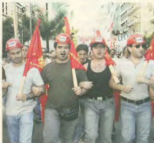
Όπως πάντα, η νεολαία του Συνδικάτου δυναμική στην πρώτη γραμμή

Αποκλειστικά δημόσιο - δωρεάν σύνταξη κοινωνικής ασφαλείας (γυναίκα, πρόνοια, συνταχή), με πληροπία στην κλήμης των αναγκών των ερ-