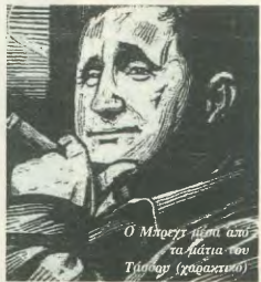
Ο Μπρεχτ μιλάει από τα λόγια του Τίπολο (γραφέας του)

Από το πολίτευμα αυτό έργο - δεδομένων των περιστάσεων σε κάθε φύλλο της εφημερίδας- παρουσιάζουμε αυτή τη φορά το ποίημα "Οδηγία στους Ανωτέρους", που έγραψε το 1927. Σχόλια δεν χρειάζονται. Κάθε αγωνιστής εργατής -οικολογός, στα χέρια του οποίου φτάνει αυτή η εφημερίδα, θα καταλάβει γιατί το επιλέξαμε.