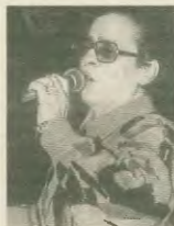
Η Σωτηρία Μπέλλου θα μείνει πάντα στις καρδιές μας

Μ ια μοναδική, ανόθευτη, λαϊκή φωνή σήγησε. Η Σωτηρία Μπέλλου πέθανε πρόσφατα, ντυμένη από τον καρκίνο Η φωνή - σύμβολο του λαϊκού μας τραγουδιού, αυτή που τόσο διηγήθηκε πολλές «κουβέντες» και μας ταξίδεψε «με αεροπλάνο και βαπόριο», εσθίρσε μετά από 50 χρόνια προσοχής, αφήνοντας μας πιστοίτη αυτηνορία τα εκατοντάδες τραγουδια που αφάρνασε με την εμπειρία της.