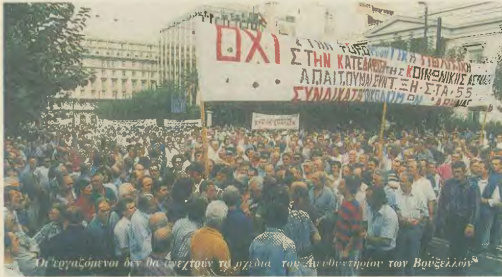
Η εργαζόμενη δεν θα αφήσει τα χέρια της για υιοθέτηση των Βούζβιλλων

των χειρότερο - της συμφωνίας του Μάαστραχτ. Επιτακτική πλέον η ανάγκη του αγώνα για την διεξαγωγή δημοψηφισμάτων