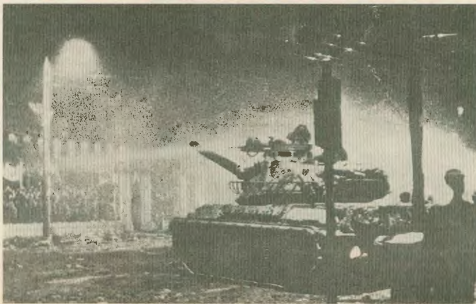
Το tank έριξε την πόρτα, αλλά μόνο προσωρινά έβγαλε η αγωνιστική φωνή του Πολυτεχνείου. Αρτηρία για την παραπέρα ανάπτυξη των αγώνων στάθηκε η εξέγερση της Νομικής το Φλεβάρη του 1973

βουλευτικά μανδύα. Ο βασικός στόχος βέβαια ήταν να «αποκοιμιστεί» και να ανακουφίσει από τα πρώτα της κιάλας βήματα την αγωνιστική πορεία, που ήταν ήδη ορατή.