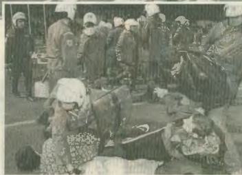
Εικόνες οργής και αγανάκτησης για τα όσα συμβαίνουν στο ελληνικό ποδόσφαιρο