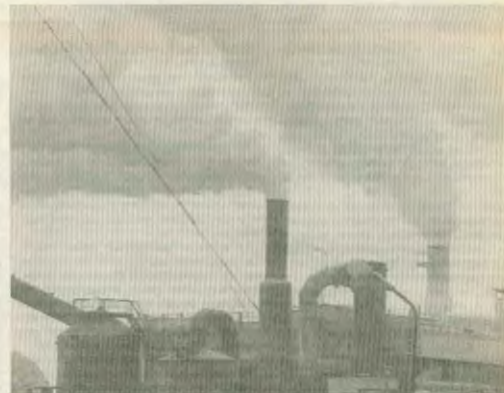
Χιλιάδες τόνοι οσίων που κατατρέφουν το όζον, εκπέμπονται από τις χημικές βιομηχανίες

δα εκτιμάται ότι κάθε χρόνο θα υπάρχουν 300 - 600 επιπλέον περιπτώσεις καρκίνου του δέρματος και 1.600 - 3.500 νέες περιπτώσεις κα-