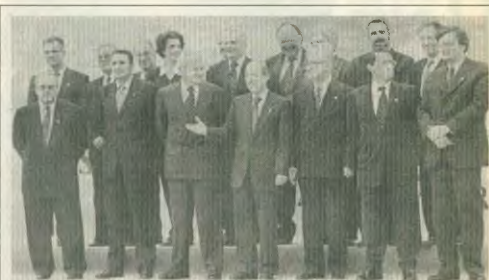
ΒΑΛΚΑΝΙΚΗ ΔΙΑΣΚΕΨΗ ΚΟΡΥΦΩΣ ΣΤΗΝ ΚΡΗΤΗ

Για μια νέα Ελλάδα, χωρίς εκμεταλλευτές και εκμεταλλευόμενους.