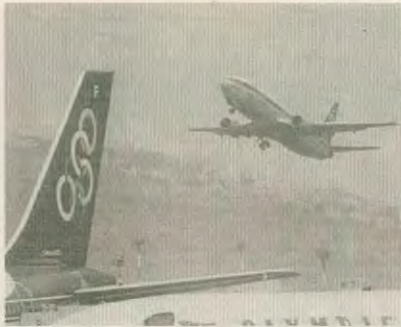
Το καμπανάκι για την Ολυμπιακή χτίσηρη ήδη και σιμά έχουν οι αέροι ΔΕΚΟ, που τώρα προσφέρονται κατά 14% φθηνότερες

Ο ταν το νόμισμα μιας χώρας που είναι συνδεδεμένο με το εξωτερικό, χάνει μέρος της αξίας του, χάνουν και όλοι όσοι συναλλάσσονται με το νόμισμα αυτό. Αν μάλιστα έχει ακολουθηθεί μια πολιτική, στα πλαίσια της οποίας αυξάνονται όλα και περισσότερο οι εισαγωγές, τότε τα πράγματα είναι ακόμα πιο δύσκολα. Η υποτίμηση ενεργοποιεί αυτόματα έναν φαύλο κύκλο συνεχών ανατιμήσεων - πρώτα στα εισαγόμενα και μετά στα εγχώρια παραγόμενα είδη - τις οποίες πληρώνει ο τελικός καταναλωτής. Δηλαδή, το σύνολο των εργαζομένων, των συνταξιούχων, των αγροτών, των άλλων λαϊκών στρωμάτων, που ξεδύνουν όλα τους το σάββατο στην αγορά αναγκάζονται ειδών καταναλώσει και υπερωρίες.