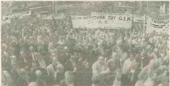
Οι εργαζόμενοι έθωσαν στις 9 Απριλίου ασταχιστική απάντηση στον κυβερνητικό αντιδικαλιισμό

Η ΓΣΕΕ στις 12-15 Μάρτη πραγματοποίησε το 29ο Συνέδριό της στην Καβάλα. Το προηγούμενο έγινε στον Αιγάριο Βουλγαρικής με κληρίδα, υποδοχόμενα, οικία, ύπνο σε μεζονέτες και ακριβά γεύματα. Το 29ο πλαίσιο της ΓΣΕΕ αποτελείται από κείμενα, το Κοινό Βήμα, δηλαδή στην ερώση. Εισάχθηκε η δυνατότητα στην αντιρρησητική πλειοψηφία των Συνεδρίων να γνωστοποιούν την Καβάλα την εποχή του χειμώνα.