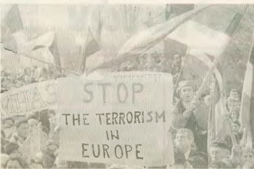
«Σταματήστε την τρομοκρατία στην Ευρώπη» Ξητών οι διαδηλωτές στο Κοσσυφοπέδιο.