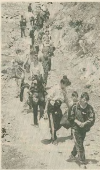
Παίρνουν τα βουνά, για να γλιτώσουν από τις εχθροπραξίες

Η αποσπείροση της κατάστασης στο Κοσσυφοπέδιο, παρά τις αντίθετες διακρίσεις, αλλά και η επέμβαση στο εσωτερικό της χώρας της περιοχής βράκονται στο επικεντρω-