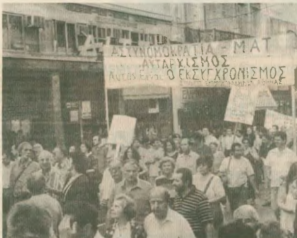
Οι εργατικοί αγώνες μπροστά στην ανελετή επίθεση του κεφαλαίου αποτελούν φιλή γεμάτα για τους καρεκλοκένταυρους του ΕΚΑ

μενα «Κανονικά Διόλογο» παρά την απόφαση του 22ου Συνεδρίου του ΕΚΑ για αποχώρηση.