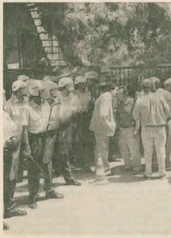
ποδιοργανώνοντας τα πάντα στην εκπαιδευτική διαδικασία. Γιατί απουσιάζει το πρόβλημα δεν είναι ο τρόπος, με

Επίθεση της κυβέρνησης δεν είναι να δώσει λύσεις στα προβλήματα της παιδείας. Αυτά εξάλλου τα επιδεινώνει με τις επιλογές της, α-