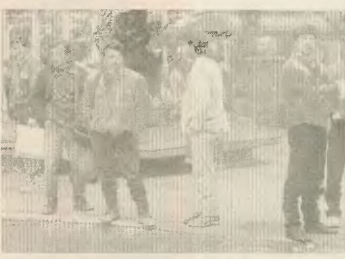
Έννοι εργάτες στην «αύται» της Ομόνοιας αναζητούν το μεροκάματο για το φαγητό της ημέρας

αυτές οι παραπάνω κυβερνητικές κορώνες. Έχουν ήδη αποκλιμαβεί και πρώτα απ' όλα στους ίδιους τους αλλοδαπούς, οι πραγματικές προθέσεις της κυβέρνησης. Εχει γίνει κατανοητό και στον πιο αφελή, πως η ίδια η διακρίση, αλλά και η ίδια η καταγραφή των αλλοδαπών στη χώρα μας, παρόν για να εφορμήσει ο' αυτούς τα στοιχειώδη κοινωνικά, εργασιακά και πολιτικά δικαιώματα. Εξοκλιωθούν και σήμερα οι αλλοδαποί να αντιμετωπιζόταν χωρίς δικαίωμα στην εργασία, στην υγεία, στη μόρφωση, να ζουν και να δουλεύουν σε όλλες συνθήκες, χωρίς προστασία και περίθαλψη και πολύ συχνά να είναι θύματα εργατικών συμπεριλητών λόγω των επικίνδυνων εργασιών που κάνουν, του προαρπρισματος, αλλά και των δυσκολιών συνεννόησης που έχουν λόγω της γλώσσας.