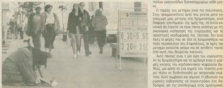
Ηλικιωμένη Μοσχοβίτισσα, σκυμμένη δίπλα σε μια πινακίδα με τις ισοτιμίες του ρωσικού νομίσματος, ζητάει ελεημοσύνη από τους περαστικούς. Εκόνες σαν αυτή είναι καθημερινές στη φτωχή πρωτεύουσα

διάφορων κρατών είναι λίγο - πολύ γνωστά. Οι κατακτήσεις κεφαλά που δεν έδωσαν σκόπη να τα επενδύσουν σε κάποια παραγωγική δραστηριότητα της οικονομίας και οι οποίοι εκτίμασαν ότι στον ορίζοντα διαφαίνονται διακινησικές στις αναλλαγματικές ισοτιμίες, καταστρώνουν τα