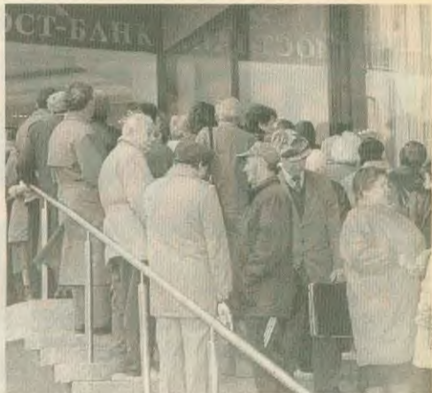
Ενώ διάφοροι καλοντυμένοι κύριοι (αριστερά) «χτυπιούνται» στα διάφορα Χρηματιστήρια για να εξαγοράσουν τα μενάλια των αφεντικών τους, οι Ρώσοι συνωστίζονται έξω από τις τράπεζες (δεξιά) για να προλάβουν να αλλάξουν τα ρούβλια τους πριν από την υποτίμηση