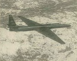
Τα αμερικανικά αεροπλάνα είναι πάντα σε ετοιμότητα για να αποκοπουν τον δίαυλο, όπου το εμψάλουν τα συμφέροντα του ιμπεριαλισμού.