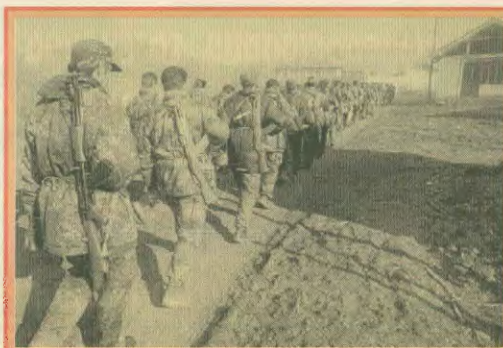
Άνδρες του λεγόμενου «Αλβανικού Απελευθερωτικού Στρατού» με πλήρη εξάρτυση. Οι αντιστασιακοί υποστηρίζονται ανοιχτά από την αλβανική κυβέρνηση και τους προστάτες της Αμερικανικής ιμπεριαλιστικής

Είναι γεγονός ότι μετά τη συμφωνία επιρροήσους στο Κοσσυφοπέδιο, οι Αλβανοί εξτρεμιστές είναι αυτοί που ευθύνονται για τα περισσότερα κρούσματα βίας. Οι πλείους όμως του ΝΑΤΟ είναι μονομερείς προς τη σωβική πλευρά και εκδηλώνονται με απειλές, κυρώσεις, πρόσθετα μέτρα και προσηγορία στατιστικών γυμνασίων. Η προσπάθεια «προσπονήσεως» της αντιπαράθεσης με τη Σερβία μέσω